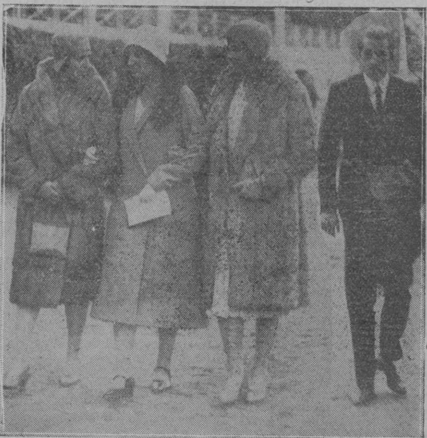
Dos aspectos diferentes de la infancia en Sevilla de la Real familia, presenta la fotografía: las Infantas doña Beatriz y doña Cristina, con la hija mayor de los Infantes don Carlos y doña Luisa, pasean por el estand durante las carreras de caballos celebradas últimamente en Tablada. En el grabado adjunto se ve a Su Alteza Real el Infante D. Jaime, paseando por el interior del recinto de la Exposición Ibero-Americana.

Muchas veces así lo hemos interesado, y para probar la procedencia y acierto de nuestra campaña, ningún testimonio más autorizado habríamos podido aducir que la circular de las autoridades sanitarias que nos ha inspirado este comentario.