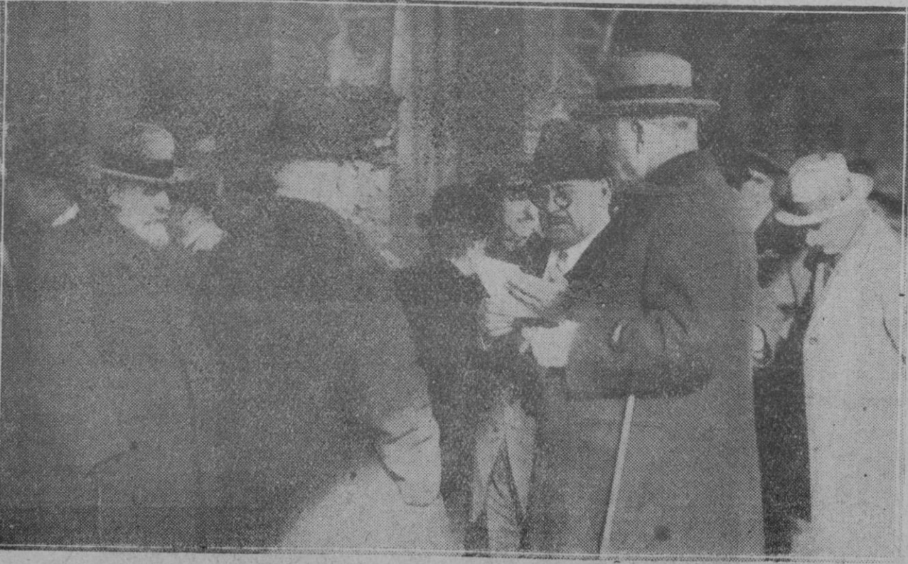
MADRID.—Llegada a Madrid del Presidente del Consejo procedente de Sevilla siendo recibido por los ministros y otras numerosas personalidades.

mente anímicos; sus móviles son los intereses materiales. Los Estados se relacionan, se alian, marchan para el cumplimiento de algún fin, pero éste tiene que ser tangible y evaluado en cifras positivas. Aun cuando en determinadas circunstancias algunos gobernantes de pueblos precocinocen alianzas por mera simpatía de raza o por algún sentimentalismo cultivado como flor en invernadero, en el fondo de la simpatía y del sentimentalismo existe el deseo de satisfacer alguna necesidad material. Sin algo de tocante y sonante los pueblos no comprenden la relación entre ellos: ventajás aduaneras recíprocas, concesiones económicas, hasta en lo que parece más ajeno a la material, por ejemplo la validez de títulos académicos, la posibilidad de ejercer profesiones intelectuales, mil actos cuya enumeración nos llevaría de digresión, hasta remotos límites, todo se traduce en conveniencia material para las personas interesadas. Esto no significa que en la satisfacción material deje de latir algo inmaterial: es evidente que nunca podremos tajar en dos pedazos la naturaleza del hombre, separando su alma de su cuerpo. Hasta en los intercambios