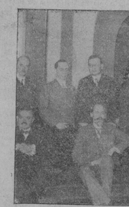
EN EL PALACIO DE LA PRENSA MADRILEÑA.—Distinguidos periodistas extranjeros, con varios compañeros de Madrid pertenecientes a la Directiva de la Asociación de la Prensa, que obsequiaron a aquellos con un lunch en su visita a la casa social

zo argentado, irá preparando el entendimiento para la lucha por la vida con la refinada cultura que el cine le traigo. De Francia aprenderá las gestas heroicas de sus cruzados medioevales; la vida toda milagro, toda santidad y toda dolor de Juana de Arco, la Doncella quemada viva por el delito de herejía, siendo santa; el esplendor de la corte de los Valois y de los Médicis... Aparecerá luego ante sus ojos el triunfo de la libertad en el comienzo de la edad contemporánea, mientras ruedan en el tablado, al tajo de la guillotina, las cabezas de María Antonieta y de Luis XVI. La fantástica fábula del Conde de Montecristo, cautivará