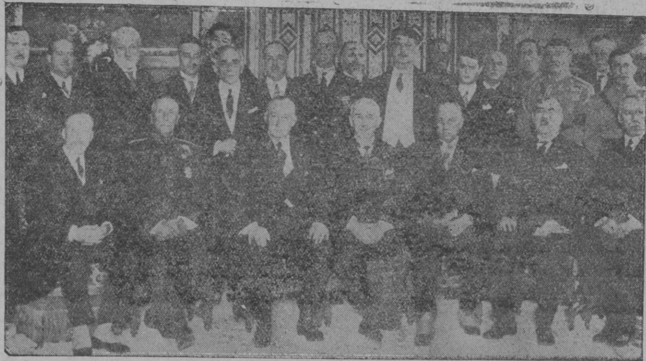
El señor Ivens Ferras con su séquito, el general Primo de Rivera y otros miembros del Gobierno español y autoridades, después de la comida con que ha obsequiado el Marqués de Estella a nuestros ilustres huéspedes, en la Secretaría de Relaciones Extranjeras.

En París se pretende hacer más y mejor. La Exposición presentará las obras atentatorias a la belleza y en cada una constará el nombre del arquitecto delincuente, del constructor, de la empresa a quien aprovecha, del propietario, corporación, ayuntamiento, etc. que lo tolera en su jurisdicción. Será una exposición a la vergüenza, hecha en París y en provincias. No hay términos legales para que los interesados se querellen.