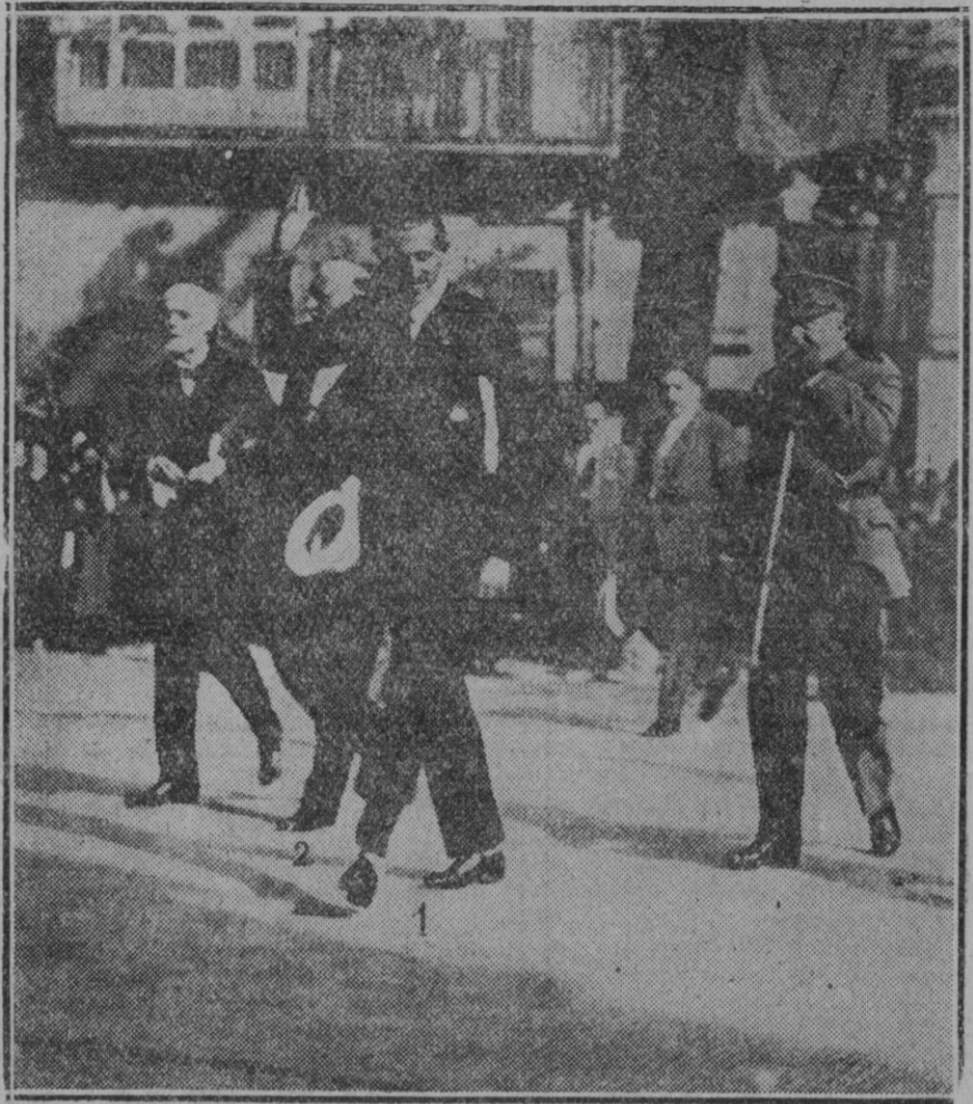
DEL VIAJE DEL INFANTE DON JAIME A MALLORCA.—Momento en que se dirigía a inaugurar el Congreso Municipalista, acompañado del Marqués de Estella, Presidente de la Diputación y Capitán General

Tres meses es un plazo antes corto que sobrado para una gestión que puede resultar laboriosa y en la que tal vez tengamos que insistir evidenciando la necesidad de ser atendidos, todo lo cual requiere tiempo, elemento que no podemos con nuestra pasividad malograr, perjudicando al hacerlo la conveniencia pública.