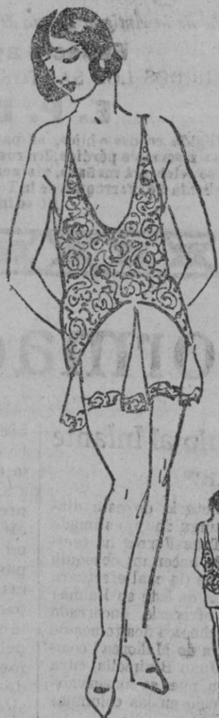
CAMISA.—Elegante camisa de encajes de alençon y crespón blanco con godets en la parte delantera.

Cuando las dimensiones de una casa lo permite podemos tener una habitación para niños: muebles de colores claros, con flores talladas.