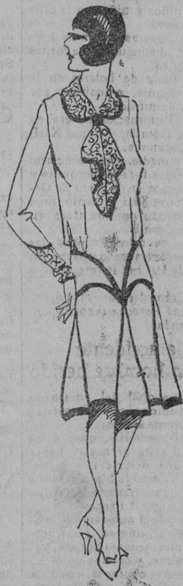
VESTIDO.—Bonito vestido de seda china cruda con puños, cuello y corbata de georgette estampado.

En los pueblos serviles, los tiranos son Señorías.