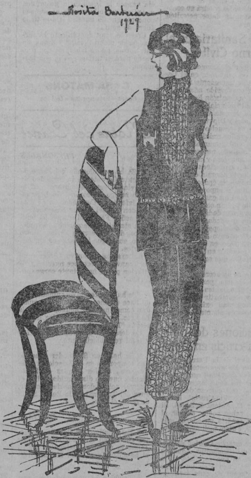
PIJAMA.—De una indiscutible elegancia es este pijama interpretado en crepé satén azul intenso y decorado en la pechera y bajos de pantalones con encajes rubios

Se hierven seis patatas grandes, con tanta agua como para cubrir las patatas y sal. Una vez cocidas se les quita el resto de agua y se ponen otra vez sobre el fuego fuerte, hasta quitarles toda humedad. Luego se pasan por la purera; se les agrega un buen pedazo de manteca, por lo menos cuatro cucharadas bien llenas de queso Gruyère rallado, un poquito de leche o mejor aun de crema de leche, una raspadura de nuez moscada y cuatro yemas. Las claras batidas a nieve en el último momento.