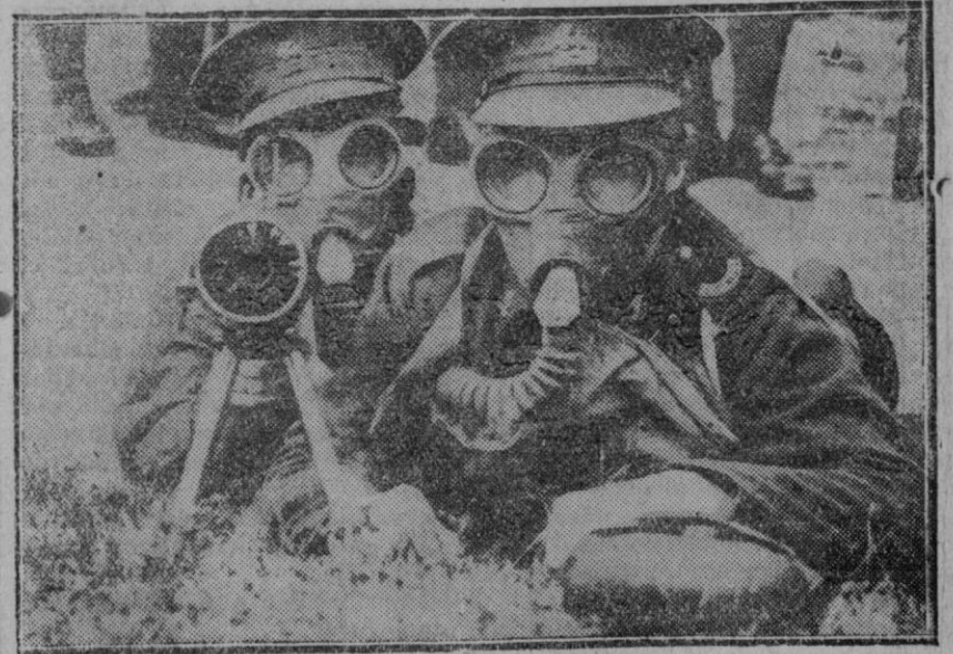
MONSTRUOS MODERNOS.— La máscara contra los gases asfixiantes da un aspecto monstruoso a estos dos soldados británicos del regimiento de ametralladoras, sorprendidos por el fotógrafo durante las maniobras de Aldershot.