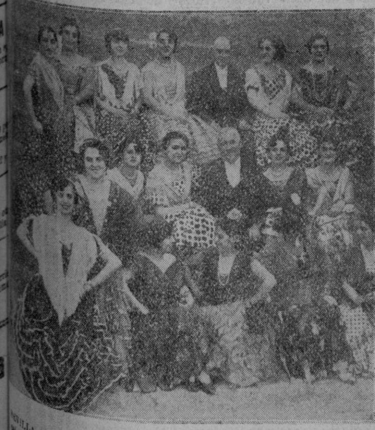
—Cuadro flamenco que actuó con gran éxito en la fiesta celebrada en honor del general Primo de Rivera con motivo de la visita que hizo el Presidente a las ruinas de Itálica.