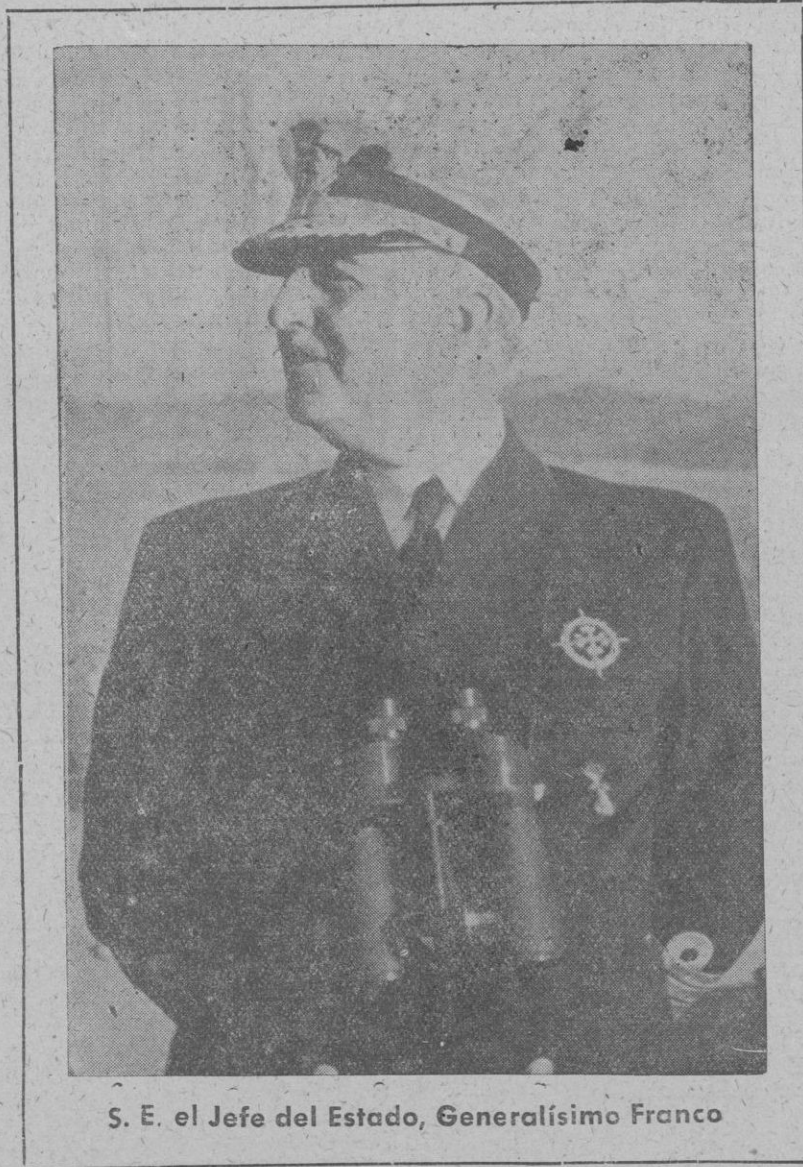
S. E. el Jefe del Estado, Generalísimo Franco

Hay cosas que no deben tocarse, porque afectan a sentimientos venerados. Díganos el «Herald Tribune» lo que piensa de la actitud de sus correligionarios húngaros, que, sin necesidad de proceso ni de torturas, se han sometido a la voluntad de los soviets y se suman a la persecución religiosa.