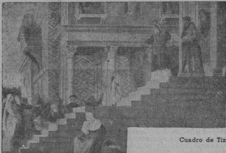
Cuadro de Tiziano

En doce años que permaneció probablemente María en el templo, ¡cuántas riquezas atesoró así esta Hija del Rey cuya hermosura es toda, es decir incomparablemente la más bella, interior! No era tan bello y magnífico el velo esculpido del Sancta Sanctorum, de sedas de rezegante colorido, tejido tal vez por sus hábiles manos, ni las fulgentes lámparas de oro despedían brillo tan continuo y suave en la presencia del Señor, ni el aroma purísimo del incienso subía tan agradable hasta su trono, como la oración y las virtudes y la encendida esridad del corazón de esta joven celestial.