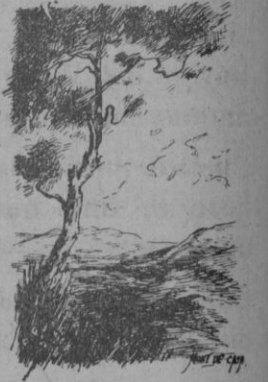
Mont de Casa

nida. Cerca estoy de nuestra ciudad, pero que distinto el ambiente, no se puede comparar ni el más nimio detalle. Son mundos distintos, completamente opuestos con sus bellezas los dos, pero sin duda alguna, el campo, la montaña donde no ha intervenido el hombre, la naturaleza se muestra más briosa y así la primavera, brio y potencia por esencia, debe de estar inspirada en el campo, en la montaña virgen o en el profundo y azulado mar.