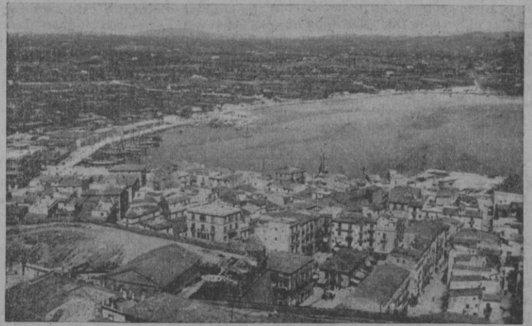
Vista parcial del Puerto, IBIZA

¡Ya desfilan los que han llegado con el vapor! Unos soldados con su equipaje tosco, de madera, llevan un cajoncito singular... Ahora pasa un señor con un maletín de papeles de negocio, además es portador de un cenacho, y a paso acompasado, como monjitas, unas lindas ibicencas llevan también su "panaret". ¡Son fresas!... el exquisito fruto, pequenísimo y jugoso que se cultiva muy principalmente en la isla hermana de Ibiza.