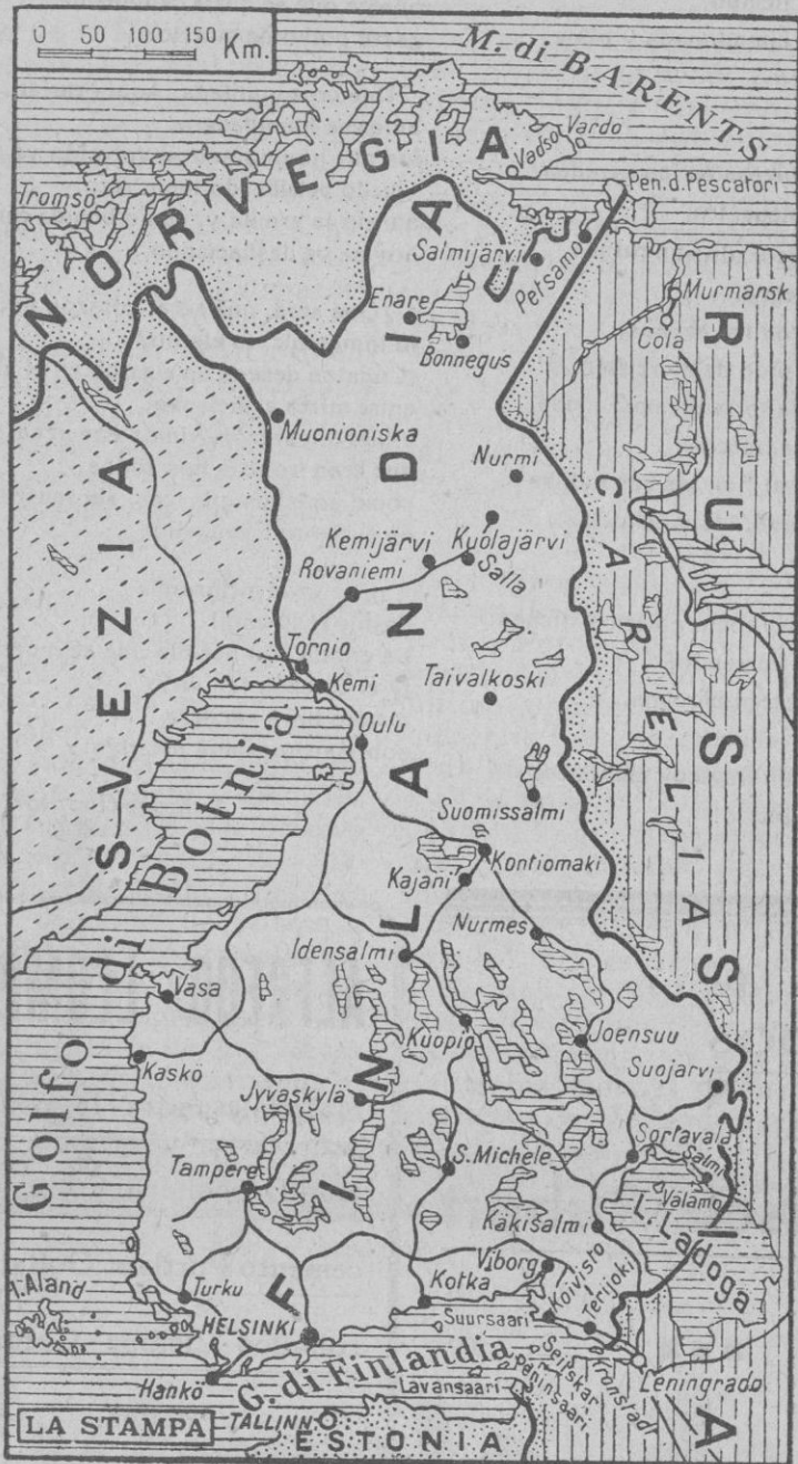
Finlandia — Teatro de la guerra