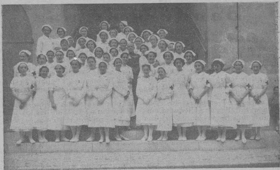
Grupo de las nuevas Damas enfermeras de la Cruz Roja.

de julio de 1936, el régimen rojo quedó en posesión de todo el importante encaje del Banco de España, depositado en Madrid, y que se elevaba, según el boletín mensual de la Sociedad de Naciones, a 2.202 millones de pesetas en oro. 656 millones en plata y 292 millones de pesetas oro en divisas extranjeras; o sea un total de 3150 millones. La circulación de billetes que entre 1930 y 1935 se había mantenido alrededor de 4.800 millones pero que se había elevado en 1936 hasta el mes de julio a 5.455 millones, estaba, pues, cubierta a razón del 57'74 por 100. Atendido que el curso de la peseta se había mantenido desde 1932 alrededor de 42 por 100 (promedios anuales en Suiza por 100 pesetas: 1932: 41'40; 43'12; 1934: 42'01; 1935: 42'06; primer trimestre de 1936: 41'975), el valor oro de toda la circulación en julio de 1936 no representaba más que 2.291 millones de pesetas oro y estaba por cubierto a razón de 108'86 por 100 sólo por el encaje oro y divisas, sin contar los 656 millones de plata, y era por tanto una de las más sólidas del mundo. Si se tiene en cuenta que esta garantía metálica beneficiaba de hecho únicamente a los billetes