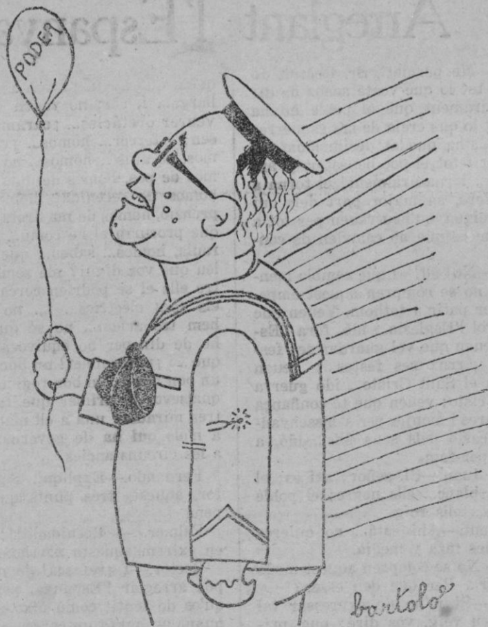
¿Qué cosa es extraña! ¡Si parece que se del vola el globito!

¿Y la autoridad? ¿Ampara a los agredidos, a los atropellados en su derecho? No: los detiene, les clausura el Centro. Los agresores, impunes. ¿Cabe pensar en más indigente injusticia?