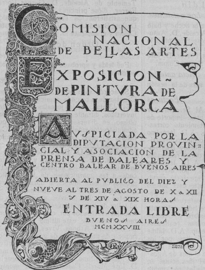
Facsimil del Cartel anunciador de la Exposición