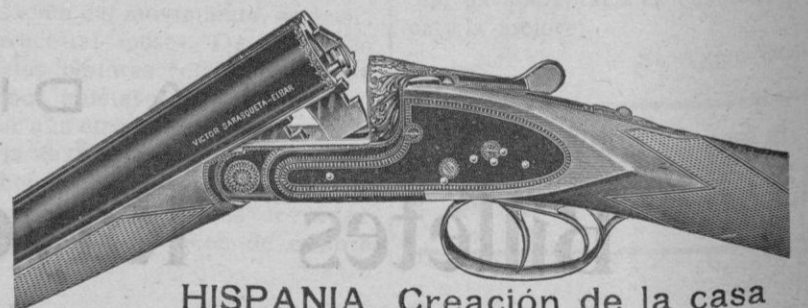
HISPANIA Creación de la casa

Proveedor y fabricante de S. M. el Rey Don Alfonso XIII