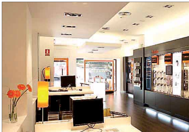
Siete de cada diez españoles han cambiado de proveedor de telefonía.

Asimismo, agrega que las telecomunicaciones es el segundo sector donde más utilizan los españoles los comparadores de precios online (únicamente por detrás de Viajes y ligeramente por delante de Seguros): un 68,8% los ha utilizado en alguna ocasión para comparar tarifas de telefonía e internet.