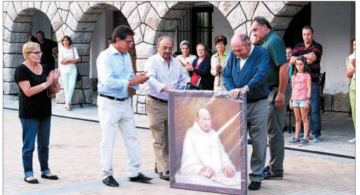
Un momento de la intervención de los dos alcaldes durante el emotivo acto. / ÁLVARO PINELA

El párroco fue obsequiado con un retrato