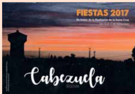
Imagen ganadora del tercer concurso de fotografía de la localidad.