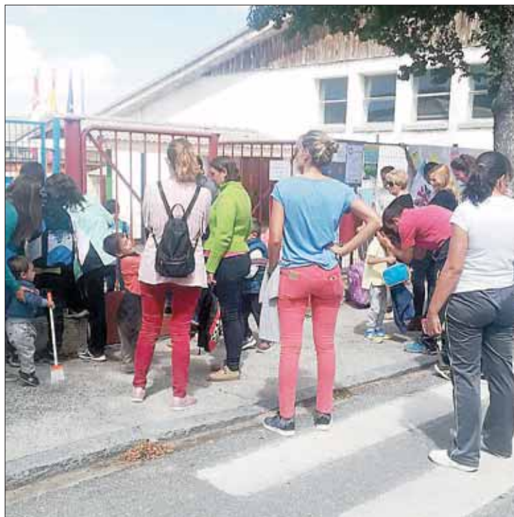
Las madres y padres esperaban la salida de sus hijos del CEIP La Pradera.