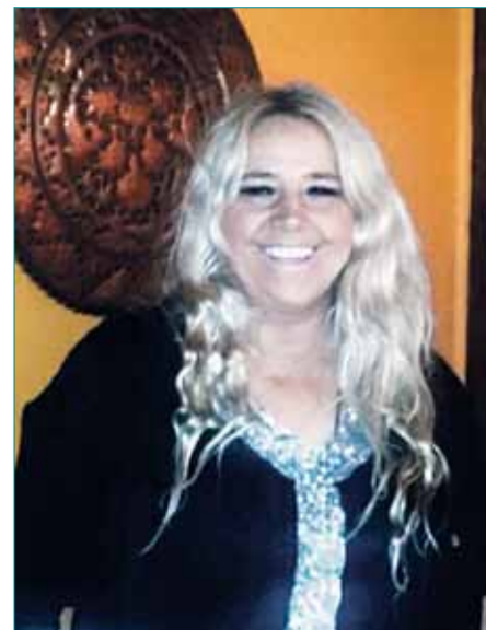
TUS AMIGOS esperamos que en el nuevo local te vaya tan bien o mejor que hasta ahora. Suerte y muchos besos.