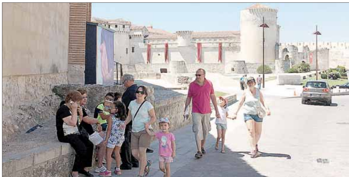
Turistas en los alrededores del Castillo y la iglesia de San Martín.

Las previsiones para este septiembre, según las trabajadoras del área de Turismo, son más que halagüeñas. Se esperan decenas de grupos, con citas concertadas, que se concentran en el fin de semana. Además, afirman que el rit-