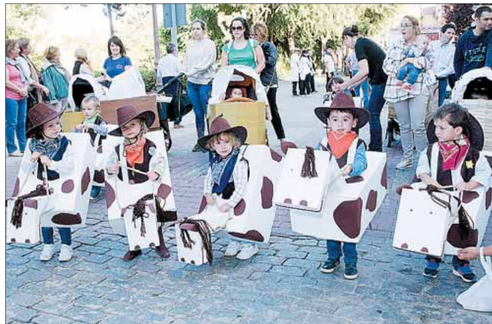
Los más pequeños, ataviados con diferentes disfraces, salieron al desfile por las calles.