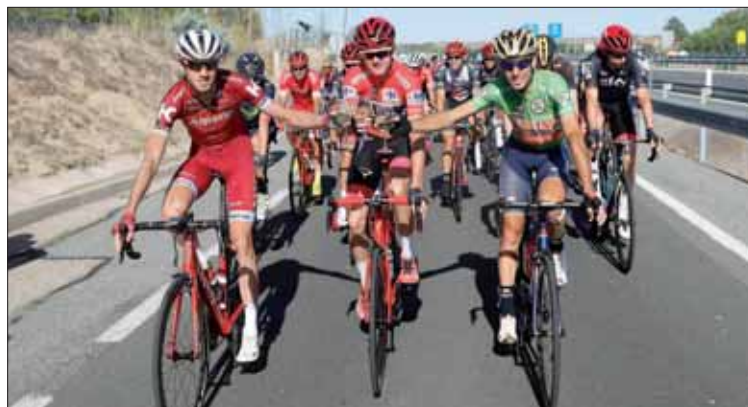
El ganador de la ronda, Chris Froome (c), brinda con Nibali (d) y Zakarin (i).

En este sentido, la etapa con más audiencia fue la del pasado