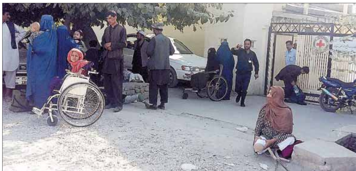
Centro de rehabilitación donde se produjo el asesinato de la cooperante española.

decretado por el Ayuntamiento que luce crespones negros en sus banderas.