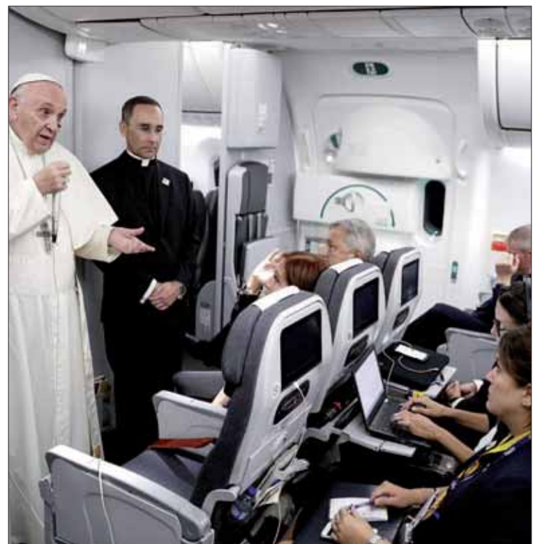
El Papa ofreció una rueda de prensa en un trayecto de Colombia a Roma.

CAMPOS DE LIBIA Por otro lado, el Pontífice denunció el uso de campos de internamiento en Libia. "La humanidad cobra conciencia de estos lugares, de las condiciones en las que viven estos migrantes en el desierto. He visto algunas fotos. Tengo la impresión de que el gobierno ita-