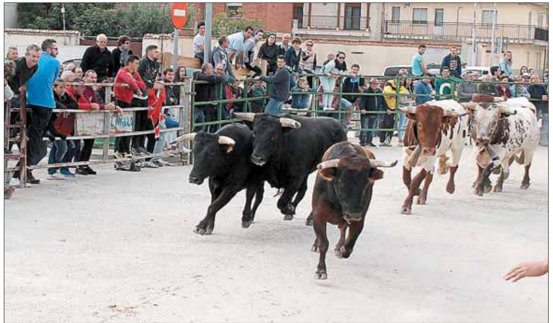
Tras el encierro campero, la organización soltó las reses por el recorrido de costumbre.

Carbonero encara así el último día de fiestas hoy martes, con el segundo y último de los encierros camperos, la tradicional comida de peñas al mediodía, el encierro de promoción vespertino y la cena de hermandad y castillo de fuegos artificiales que pondrán fin a estos días. El grupo Musical 60 amenizará la última velada musical, a partir de las 23.00 horas en la Plaza de España.