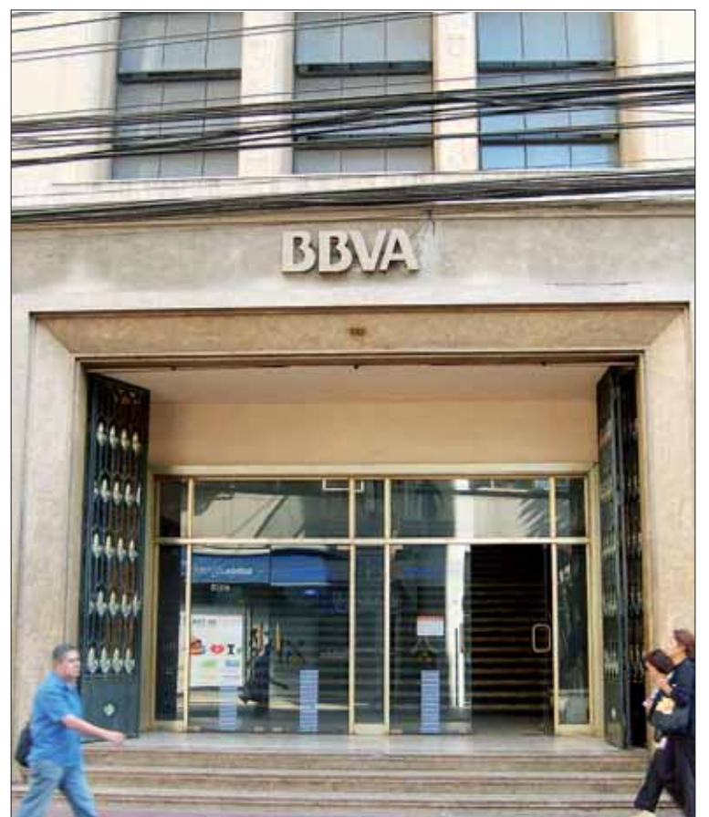
BBVA contaba en la región a cierre del primer semestre con 80.000 pólizas.

En Castilla y León, a cierre del primer semestre, BBVA contaba con más de 80.000 pólizas en el área de seguros particulares, entre ellas 43.000 de hogar, 23.000 de vida y 12.000 pólizas de vehículos, detalla el comunicado. En cuanto a la valoración de los productos de seguros entre clientes de BBVA, el resultado de la reciente encuesta realizada ha situado el índice de recomendación neto (NPS) en un +18 por ciento entre los clientes particulares mixtos de banca comercial, experimentando una positiva evolución de +4 puntos interanuales.