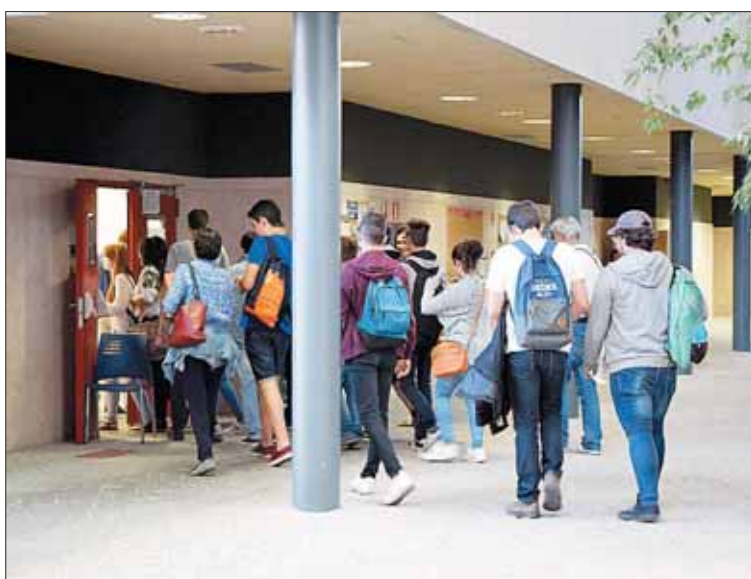
Los estudiantes tuvieron examen por la mañana y por la tarde.

En el CRA El Encinar, de La Losa, y en el CRA Retama, de Valladolid, se ampliaron aulas, por 31.000 y 33.000 euros, respectivamente. Y al IES Duque de Alburquerque, de Cuéllar, se destinaron 8.108 euros para la reparación de deficiencias.