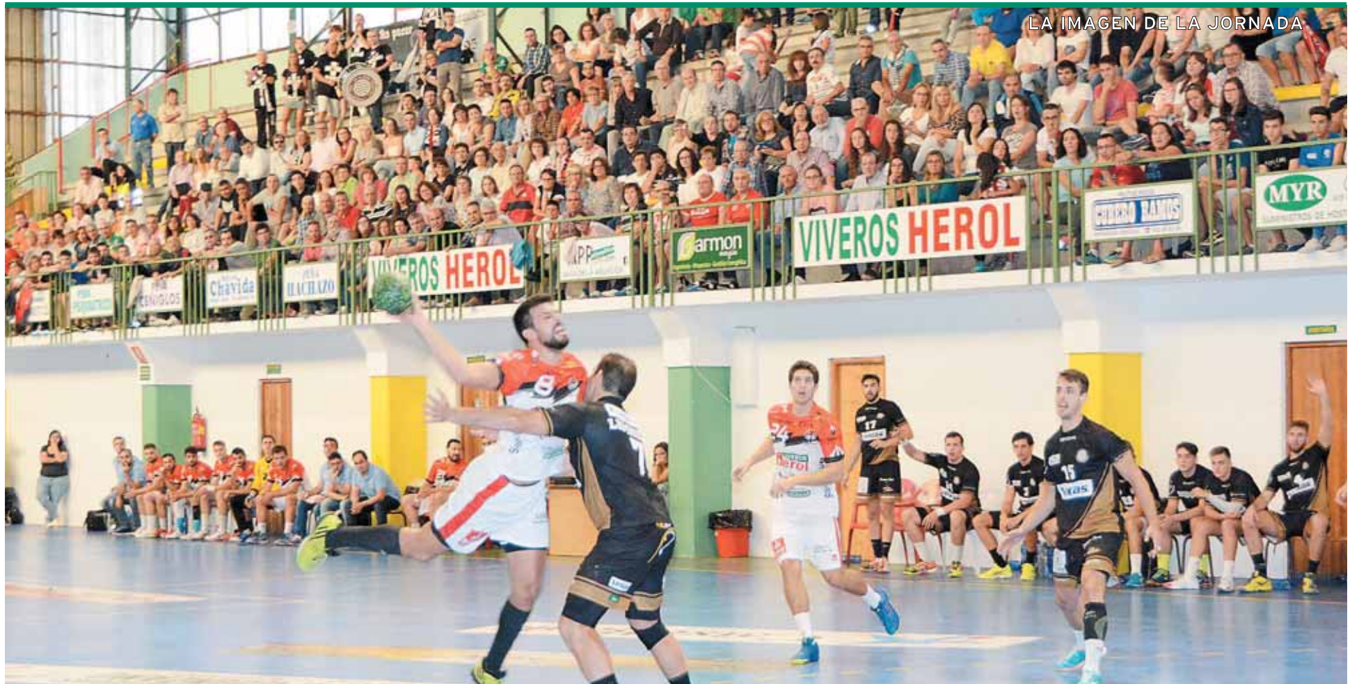
LA IMAGEN DE LA JORNADA

BALONCESTO España, a la búsqueda de las medallas ante Alemania en el Eurobasket. P.41