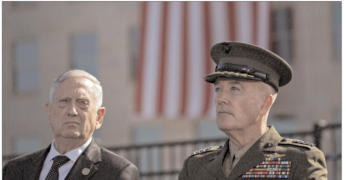
El secretario estadounidense de Defensa y el jefe del Estado Mayor Conjunto de EEUU durante la ceremonia.

"Nuestra nación prevalecerá y el recuerdo de nuestros seres queridos nunca jamás morirá", ha dicho Trump, quien ha defendido la fortaleza de Estados Unidos frente a quienes en 2011 querían "incitar el miedo y la debilidad". "No se puede intimidar