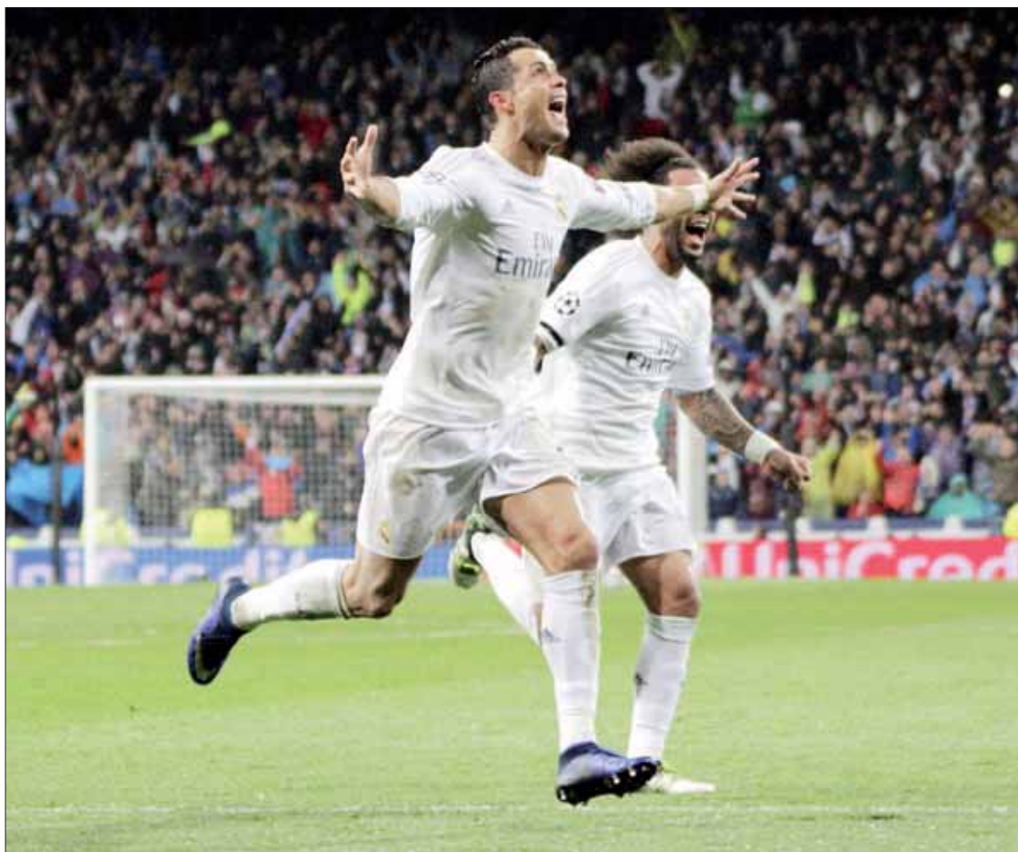
Cristiano Ronaldo y Marcelo celebran un gol en la última edición de la Liga de Campeones.

Sin ningún fichaje estelar, el actual campeón tendrá un duro camino para defender su trono, después de quedar encuadrado en un grupo junto al Borussia Dortmund