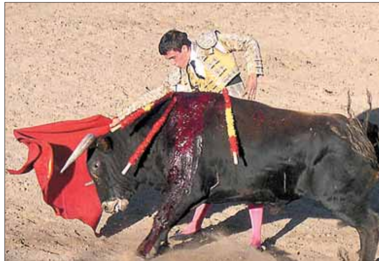
El Audureño entusiasmó al público en el sexto novillo.

Lentos tres lances con media verónica bien trazada. Doblones