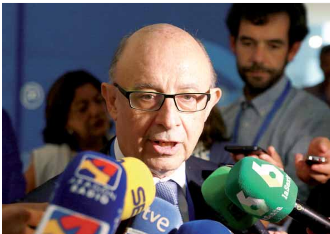
El ministro de Hacienda y Función Pública, Cristóbal Montoro.

El Ejecutivo cuenta con el apoyo de sus socios de investidura y de los partidos que ya respaldaron los PGE de 2017 y el techo de gas-