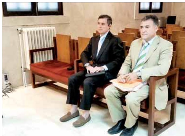
Jaume Matas se enfrenta a cuatro años de prisión.

Así, justificó esta construcción, "una iniciativa municipal" debido a que el mundial era "un gran acontecimiento internacional" y tenía que desarrollarse "con éxito, como así fue" existía un "déficit muy importante en Palma de este tipo de infraestructuras" y se quería dar "un espaldarazo" al "ciclismo en pista".