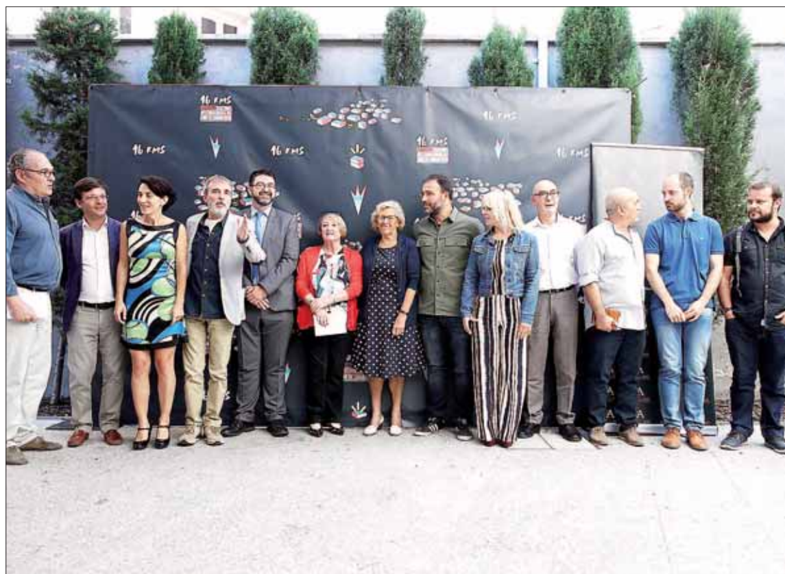
La alcaldesa de Madrid, Manuela Carmena (c), durante la presentación del certamen en la Academia de Cine.