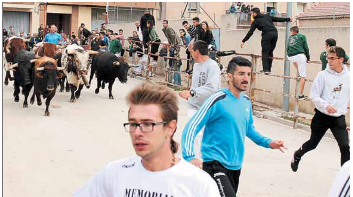
Multitud de jóvenes corrieron delante de los astados una vez llegaron a las calles.