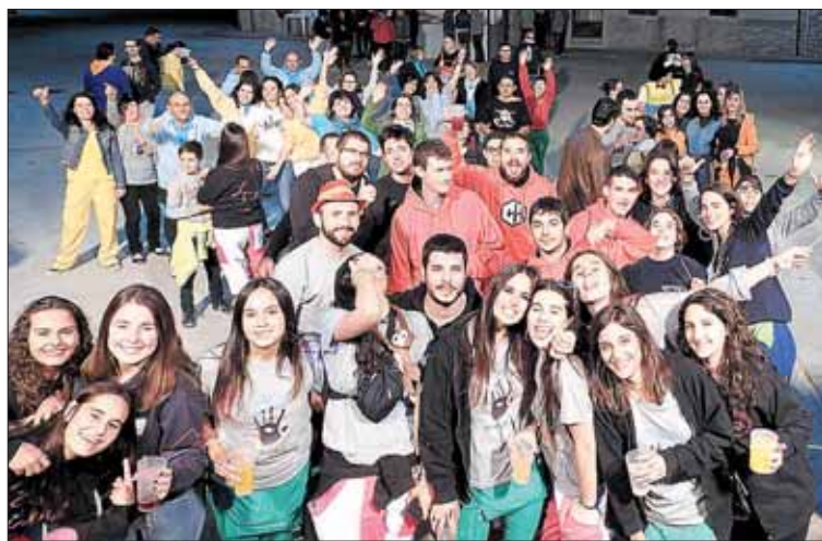
En la imagen, varios vecinos durante una de las verbenas.

Tras este arranque, los asistentes recuperaron rápidamente las fuerzas para asistir al pasacalles y dianas que se celebraron el sábado