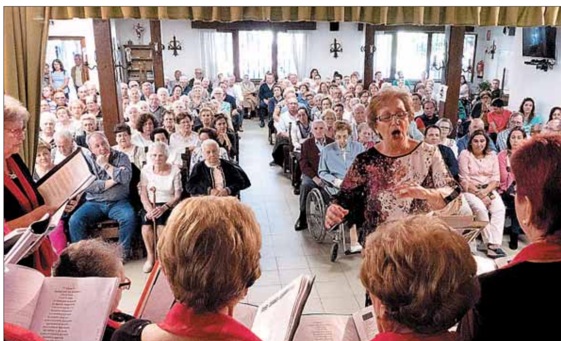
Los mayores de El Espinar mostraron sus destrezas corales durante el acto de homenaje.

Paralelo a la celebración del homenaje a los ancianos, los más pe-