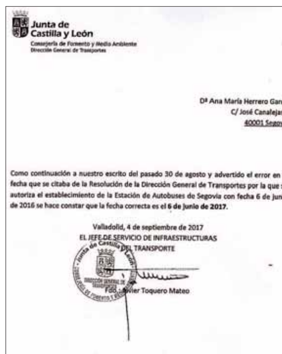
Documentos remitidos por la Dirección General de Transportes de la Consejería de Fomento a la Plataforma.

Ayuntamiento esperará hasta tener la declaración oficial para “empezar a tramitar todos los aspectos y que empiece a funcionar como un servicio municipal, que lo