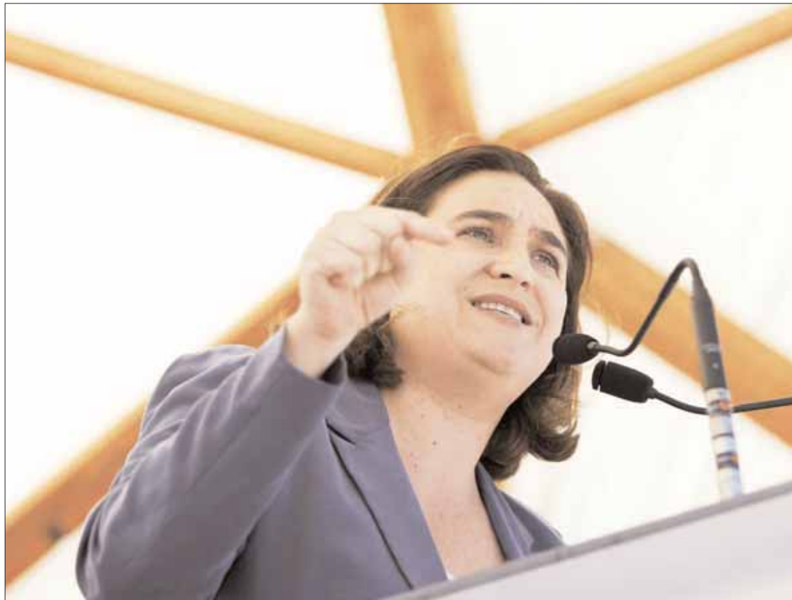
La alcaldesa de Barcelona, Ada Colau, durante su intervención en el acto de Santa Coloma de Gramenet.

Govern y desde JxSí se les tache de equidistantes, de ambiguos y de cobardes: "¡Hasta aquí hemos llegado. No aceptamos lecciones de nadie y menos de convergentes que hasta hace poco no tenían ni idea de desobediencia civil!", dijo.