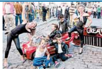
Un momento del concurso de disfraces infantiles.

MUNICIPAL La Estación de Autobuses tiene esta categoría desde el 6 de junio.