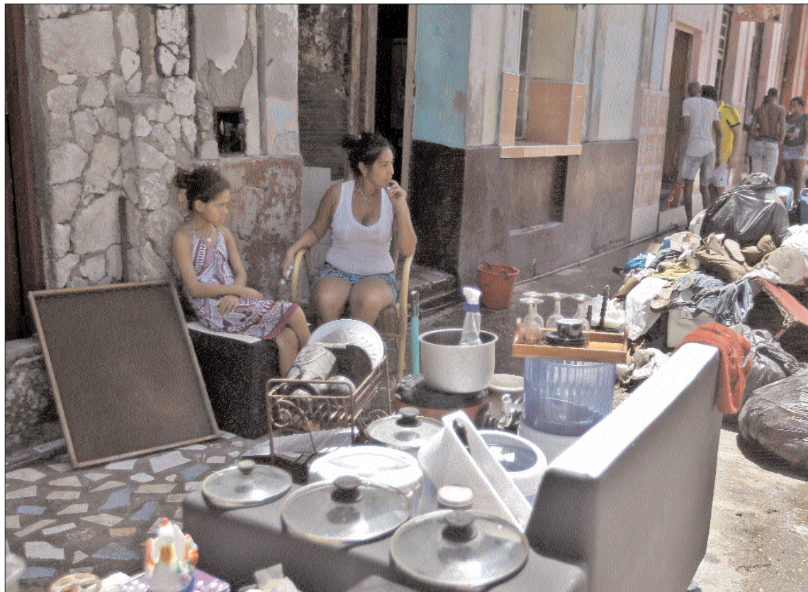
Varias personas sacan sus pertenencias fuera de la casa para que les de el sol tras el paso del huracán.

La ayuda europea “inicial” de dos millones beneficiará a las islas “más afectadas en el Caribe y apoyará sectores clave” como el agua y sanitario, gestión del agua, salud y logística, precisó, quien garantizó “plena solidaridad” con