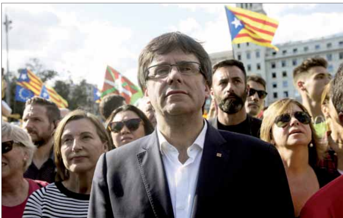
El presidente catalán, Carles Puigdemont, durante la manifestación con motivo de la Diada.

“Es muy difícil que puedan cambiar ahora su lógica de pensamiento único, mediante el cual todo lo que ha pasado aquí no ha pasado o es gente fanatizada”, lamentó el presidente.