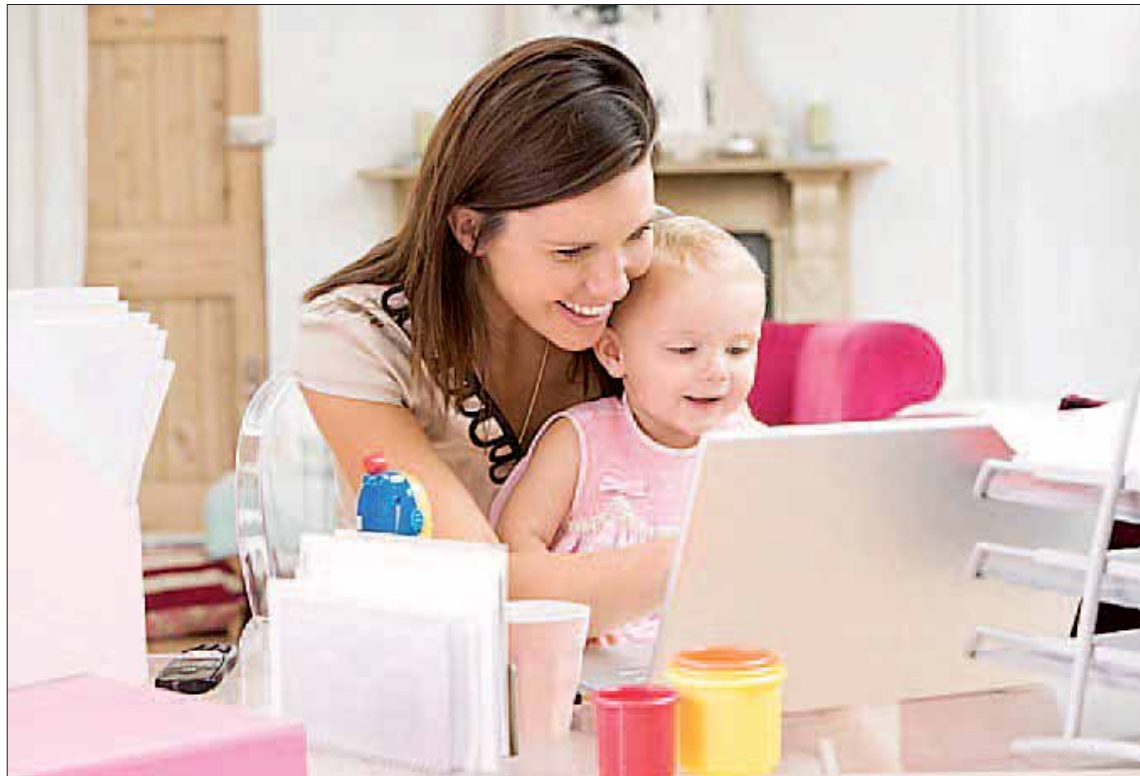
El estudio revela que más de la mitad de los encuestados reconoce haber tenido menos hijos de los que deseaba.

"Este estudio refleja el gran drama que viven muchas madres o potenciales madres que quieren tener hijos y no pueden o, cuando los tienen, no cuentan con ningún apoyo en la empresa", afirmó durante la presentación la profesora Nuria Chinchilla, directora del Centro Internacional I-WILL (IESE Leadership), que ha advertido de que "es muy representativo de lo que está pasando en España", donde, "no hay políticas progresistas de apoyo