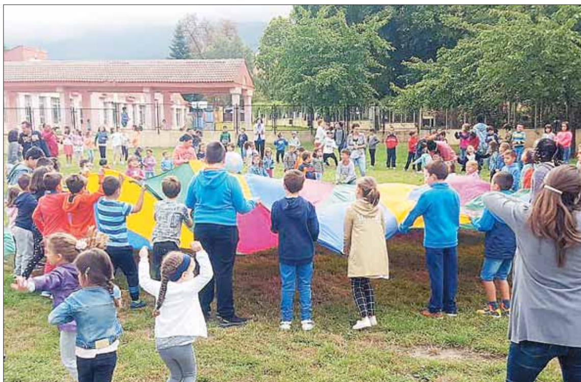
Los alumnos del CEIP Agapito Marazuela lo pasaron en grande en su primer día de colegio.

“Han sido dos meses de trabajo coordinado entre la concejala de Educación y el nuevo equipo directivo del colegio, la renovación de mobiliario de la Dirección Provincial de Educación en algunas de las aulas o en donde, además,