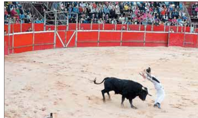
Uno de los participantes efectuando un recorte durante el concurso.