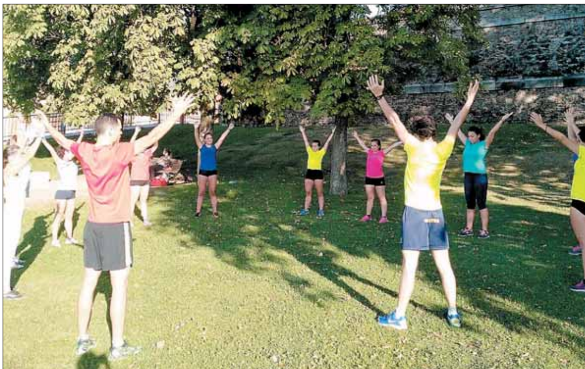
Varios de los componentes del Segovoley inician el entrenamiento en el parque de los Depósitos.