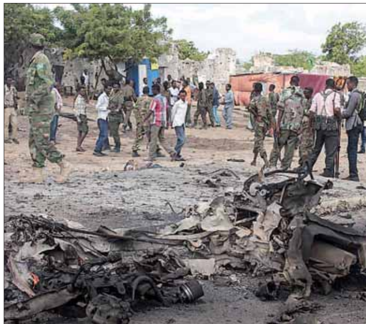
El atentado ha tenido lugar en una base militar cercana a Kenia.

El presidente somalí, por su parte, Mohamed Abdullahi Mohamed, conocido como 'Farmaajo', declaró en abril el estado de guerra en todo el país y dio a Al Shabaab un plazo de 60 días para participar de una amnistía, pero el grupo lo rechazó.