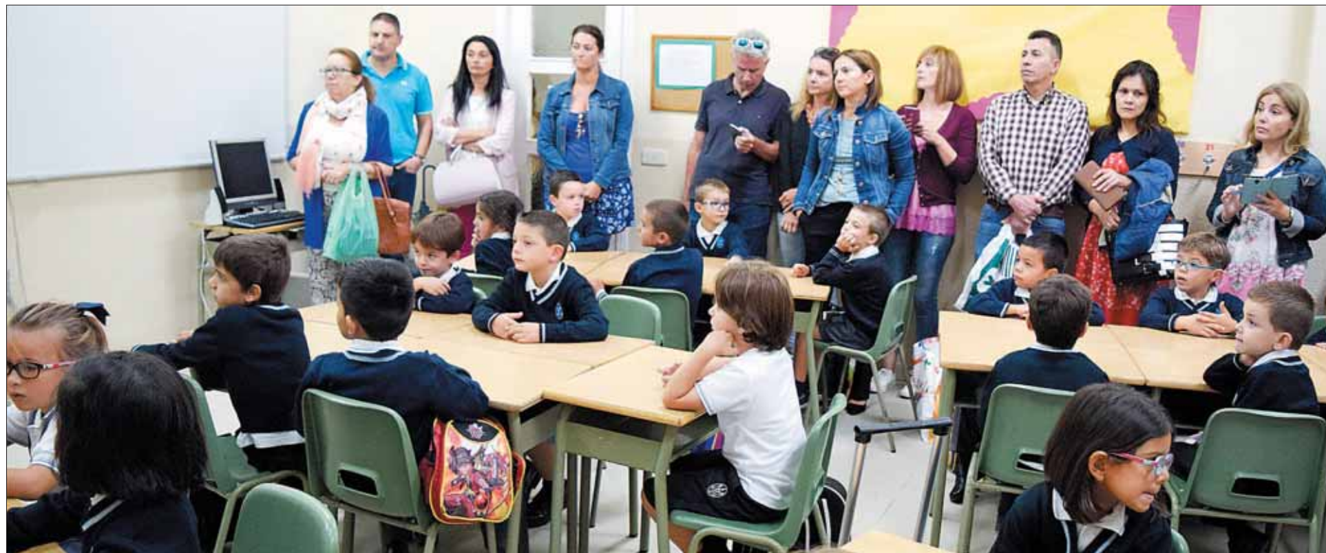
Padres y niños se enfrentaron ayer a la 'vuelta al cole', que progresivamente irá llenando las aulas de los centros educativos de Segovia capital y provincia.