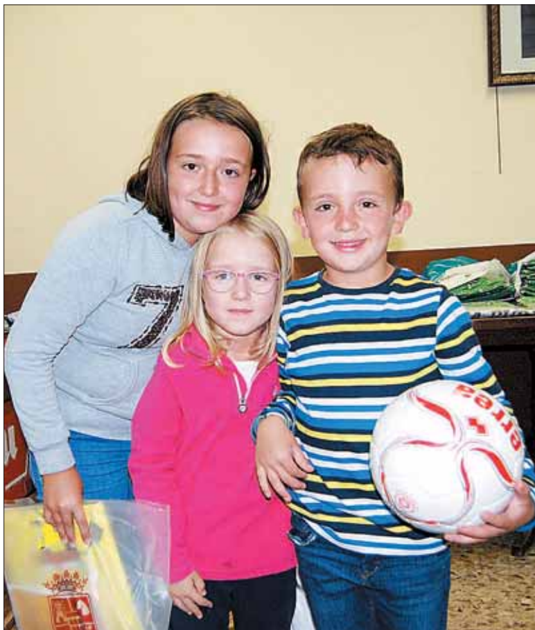
Los ganadores más pequeños de la edición del ya tradicional concurso de verano de la localidad de Zarzuela del Monte.