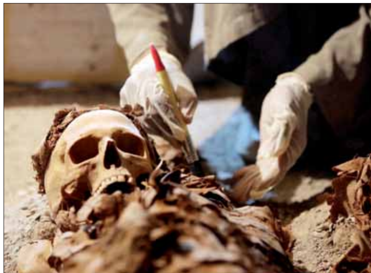
Uno de los arqueólogos descubre uno de los cadáveres del nicho.

El segundo pozo fue descubierto a la izquierda, donde se descubrió una colección de sarcó-