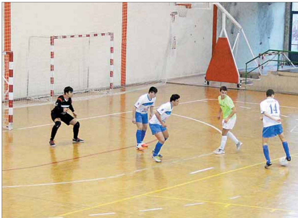
Una jugada del encuentro que jugó el Eufón Cuéllar en la cancha del FS Salamanca.

LA LASTRILLA No pudo iniciar de mejor manera el CD La Lastrilla su aventura por la División de Honor juvenil. Al igual que el Eufón, el equipo dirigido por Adrián Velasco se desplazó a Salamanca, para medirse al Albense