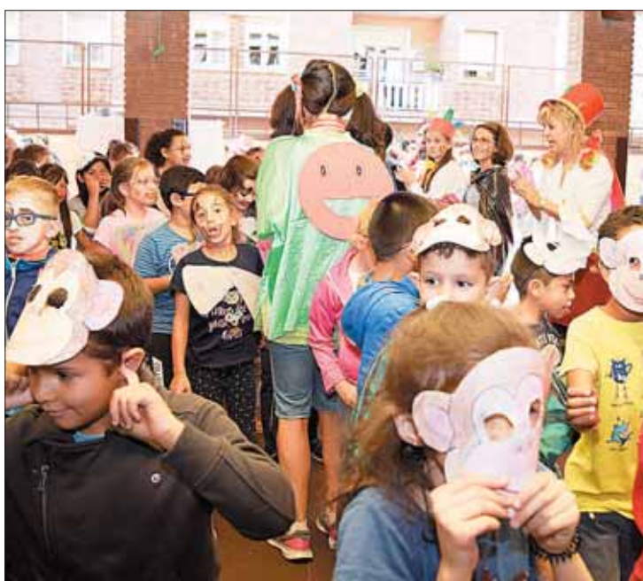
Un total de 4.136 alumnos se desplaza en transporte escolar.

La inversión total de la Junta para este servicio es de 5,3 millones de euros y el primer día funcionó como un reloj, sin inciden-