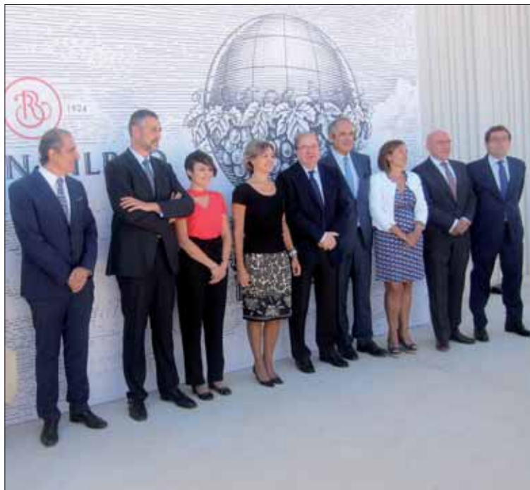
Inauguración de la bodega de Ramón Bilbao en Rueda.

Así, Herrera incidió en la "fortaleza" del sector vitivinícola de Castilla y León, ya que uno de cada cuatro vinos de calidad que se venden en España tiene su origen en la Comunidad, con una cuota del 24,3 por ciento en el mercado tradicional y del 29 por ciento en la hostelería, según los datos de 2016.