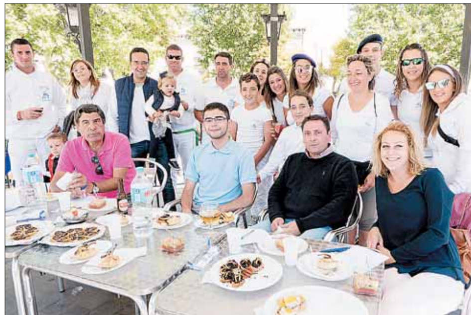
La peña El Tocón organizó de nuevo el concurso de tapas, resultando un éxito en esta edición.