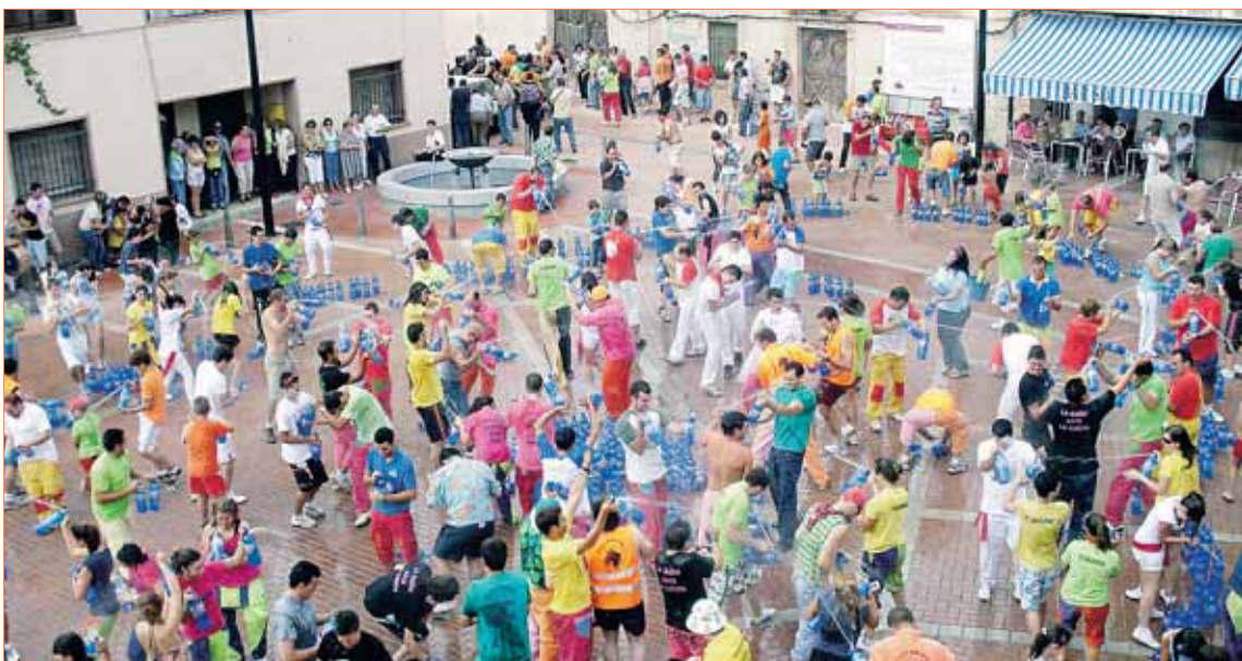
Alegría desbordada durante la sifonada celebrada el pasado año en la localidad segoviana de Cabezuela.

Mañana arrancan cinco jornadas de celebraciones cargadas de eventos para todos los públicos en honor de la Exaltación de la Santa Cruz