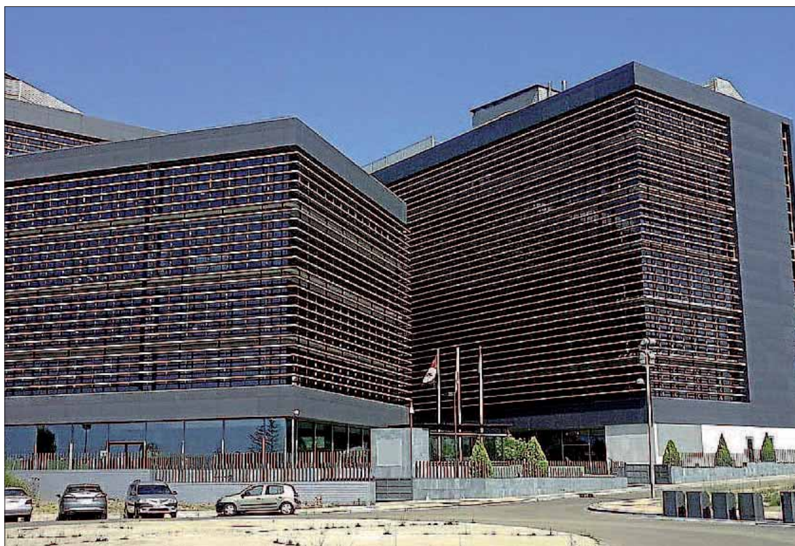
Edificio de Soluciones Empresariales de Arroyo de la Encomienda, en la provincia de Valladolid.