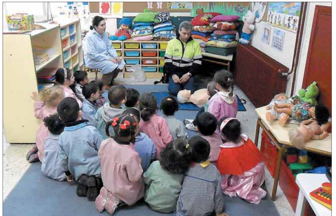
El colegio Santa Eulalia mantiene una amplia programación de actividades durante todo el curso.