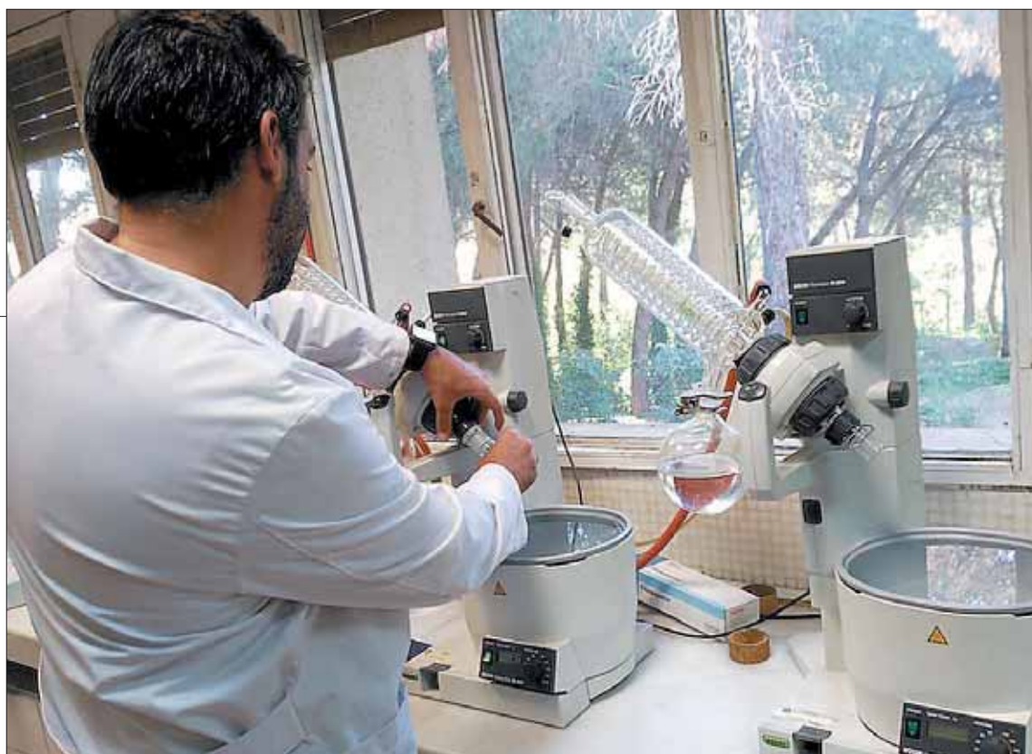
Los profesionales llevan a cabo una concienzuda investigación de los posibles agentes contaminantes/

A lo largo del año 2016, han sido 19 los nuevos municipios que han solicitado los servicios del Laboratorio, ubicado en la capital junto a la residencia Juan Pablo II. En numerosos casos, los pueblos han querido ampliar los compromisos ya adquiridos y han pedido también que Prodestur se encargue del control del agua de las piscinas, para cumplir con el RD 742/2013, que establece los criterios técnico-sanitarios de la calidad del agua y el aire de las piscinas. Así, Prodestur lleva también la gestión en más del 50% de las setenta piscinas de titularidad municipal existentes en la provincia.