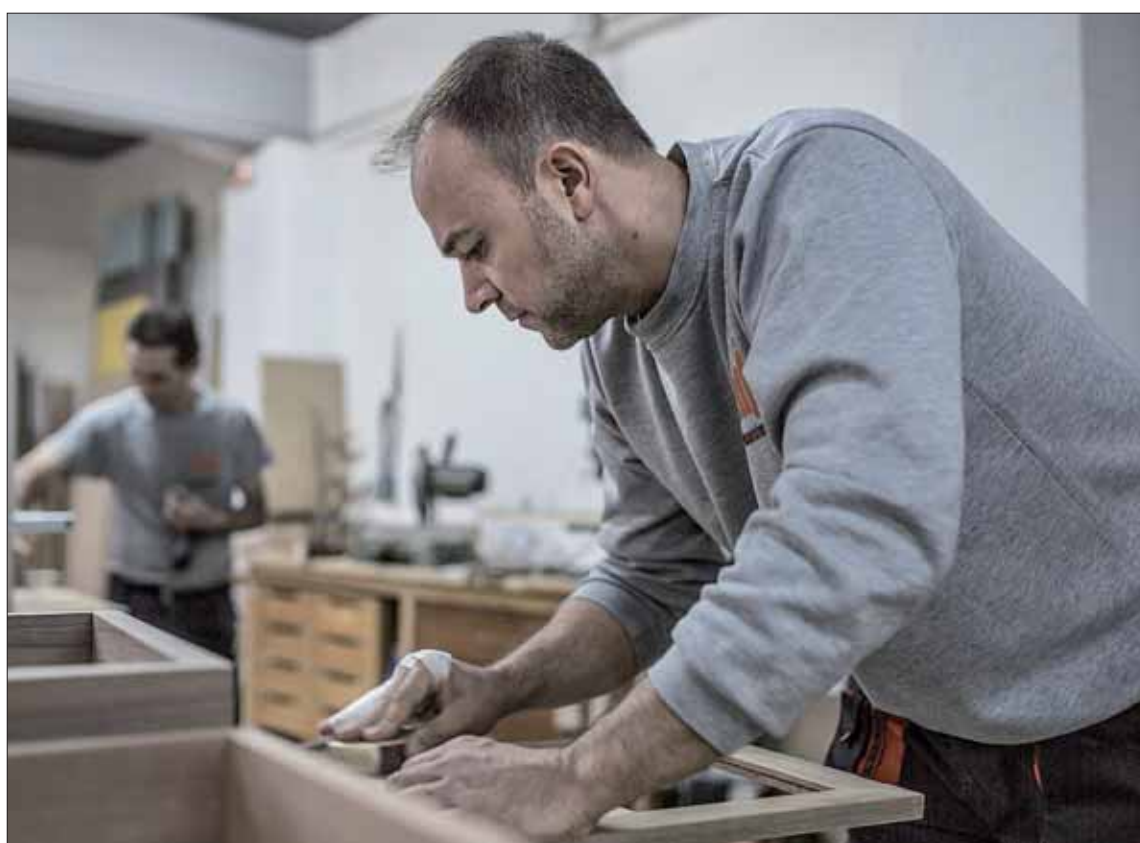
Los salarios en España únicamente están por delante de Portugal y de los países del Este de Europa.

Por sectores, a la cabeza se encuentra el comercio al por mayor y al por menor y la reparación de vehículos de motor y de motocicletas, aunque en el conjunto de la