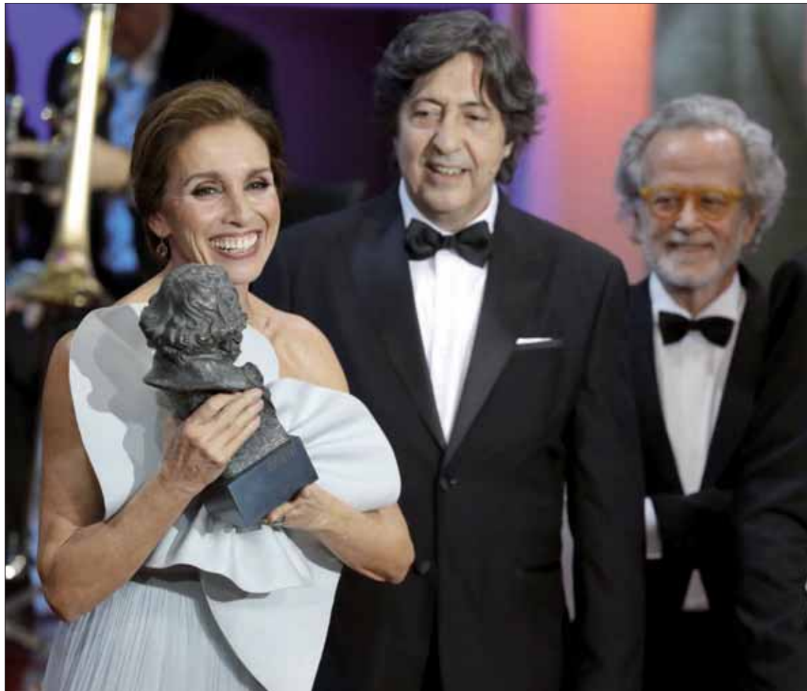
La actriz, cantante y directora Ana Belén recibe el Goya de Honor por una trayectoria compuesta por más de 50 títulos.

Tras resaltar la precariedad laboral del sector, incidió en el papel de las mujeres en el cine. "¿Por qué cuesta tanto trabajo que a las mujeres se nos reconozca como a los hombres, incluso en una profesión tan liberal como la nues-