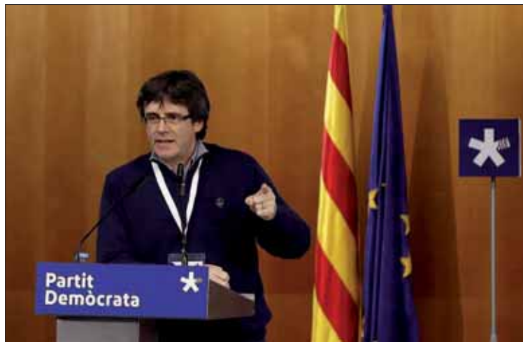
El presidente de la Generalitat de Catalunya, Carles Puigdemont.

Preguntado por si, al no contar con el aval del Estado, podría convertirse en una consulta como la