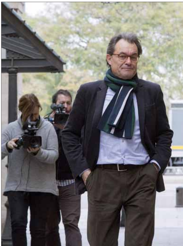
El expresidente de la Generalitat de Catalunya, Artur Mas posa ante la prensa.

La clave del juicio será comprobar cuál fue el papel que Mas,