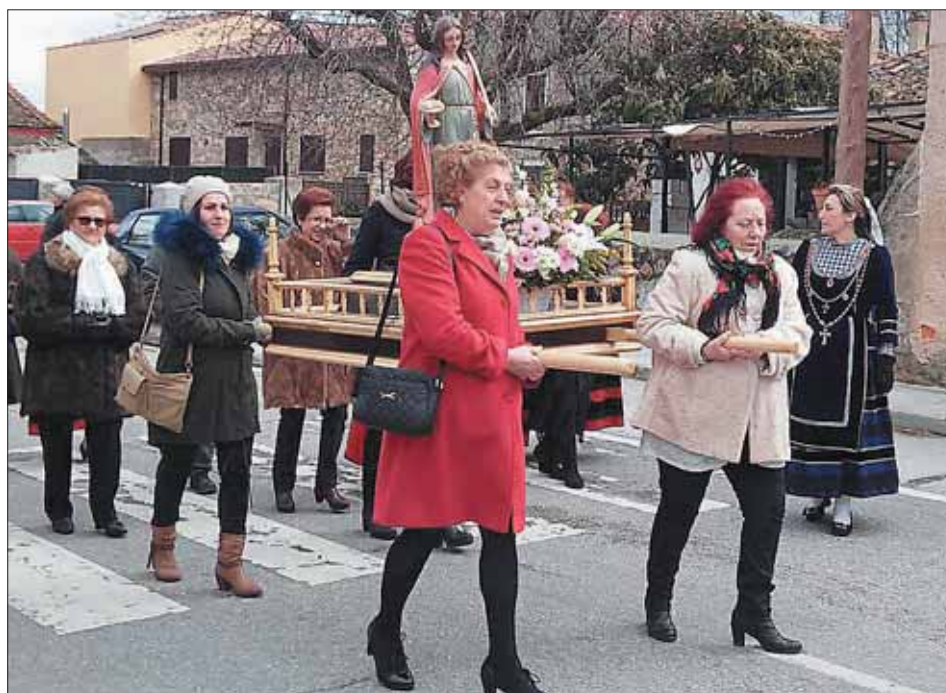
ORTIGOSA DEL MONTE. Fémimas llevando en andas una imagen de Santa Águeda.