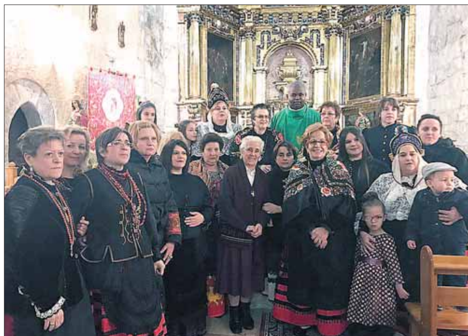
LA LOSA. La festividad sirvió para unir a mujeres de todas las edades de la localidad.