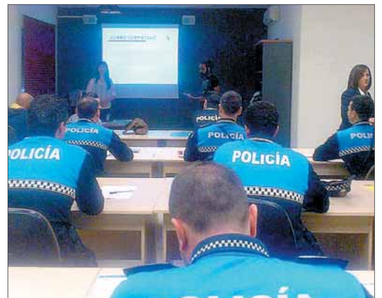
Los doce agentes de la Policía Local, en una de las clases.

El quinto se centra en las técnicas y el adiestramiento profesional y en él se imparten técnicas de tiro con armas de fuego, defensa personal y educación física. Finalmente, el sexto módulo tiene carácter transversal y de él forma parte la asignatura de inglés y el conocimiento de la aplicación de gestión policial Eurocop.