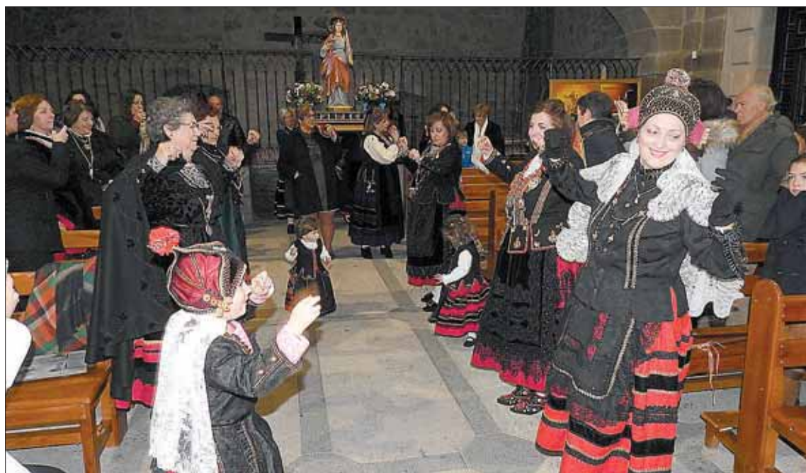
Procesión por el interior de la iglesia de San Eutropio, en El Espinar.