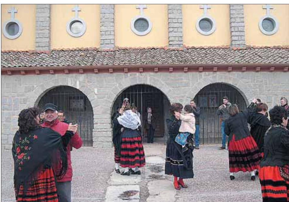
SAN CRISTÓBAL DE SEGOVIA. A pesar del frío, hubo ganas de echar un baile.