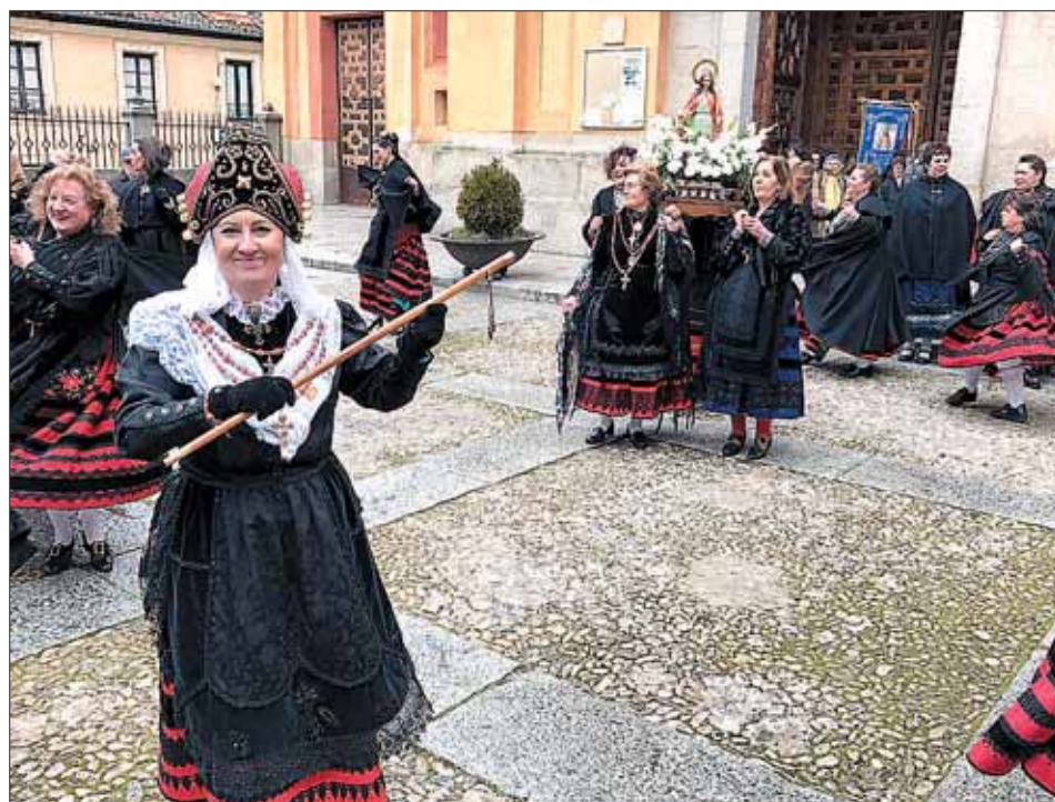
REAL SITIO. Inicio de la procesión, ayer, en La Granja.