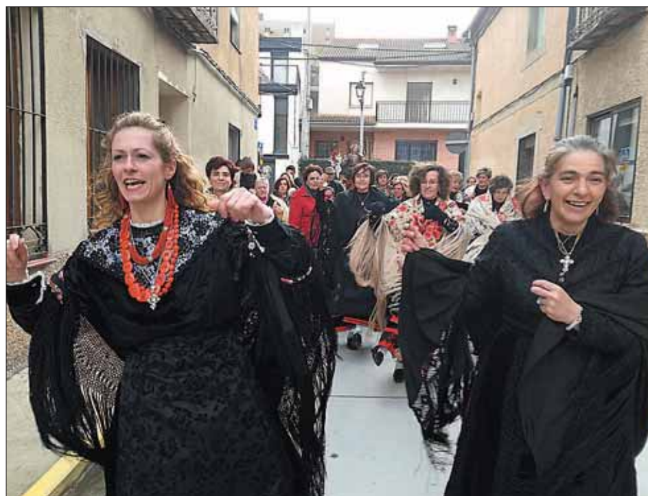
BERNUY DE PORREROS. Alegre procesión con la imagen de la mártir por el pueblo.