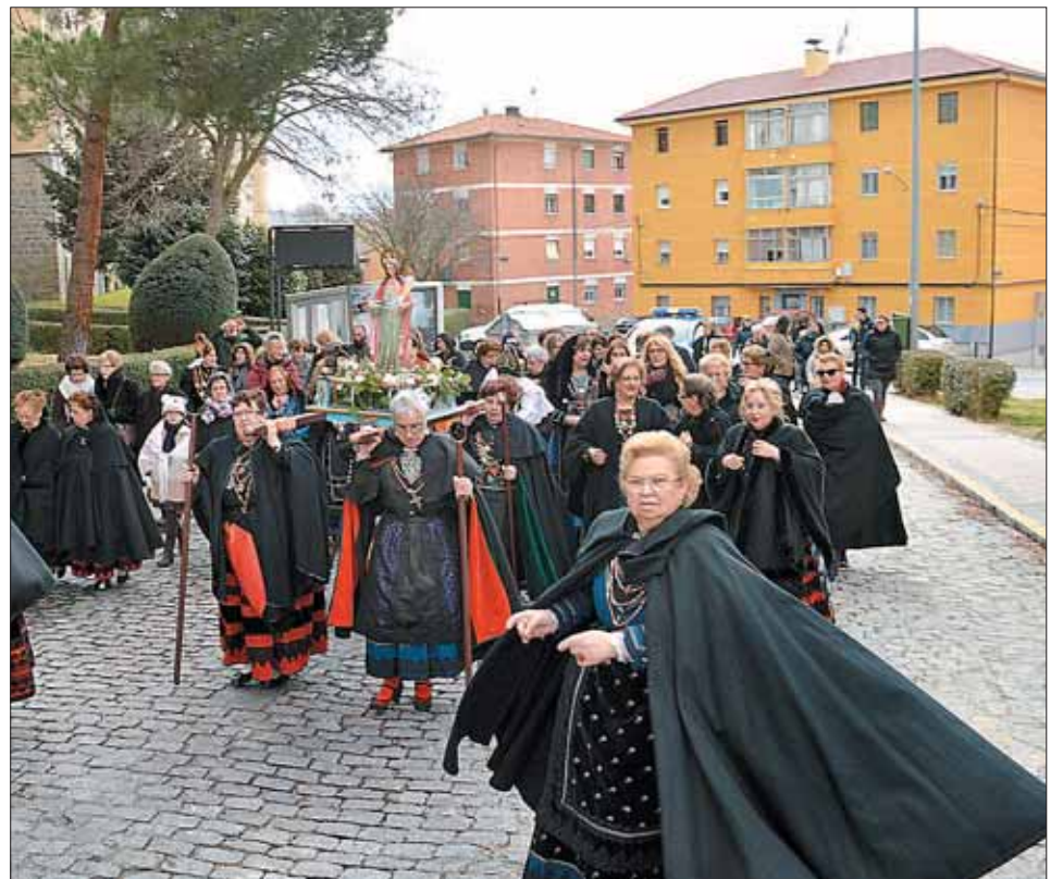
La imagen de Santa Águeda fue portada a hombros por las aguederas y recorrió las calles del barrio en una mañana fría, en la que los bailes eran la única forma de entrar en calor. / TAMARA DE SANTOS