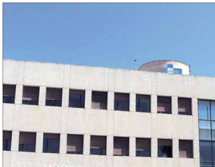
La imagen muestra la fachada principal del Hospital Comarcal de Melilla.

Según informaron a Europa Press fuentes sanitarias, la joven menor de edad fue operada con éxito y está fuera de peligro, por lo que fue trasladada a planta con pronóstico reservado.