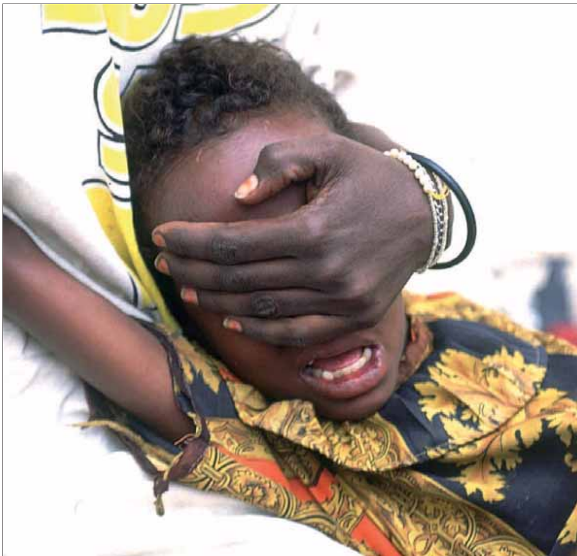
La ablación continúa realizándose en 29 países de África, Asia y Oriente Próximo.

Según señalaron las organizaciones, que buscan la implicación