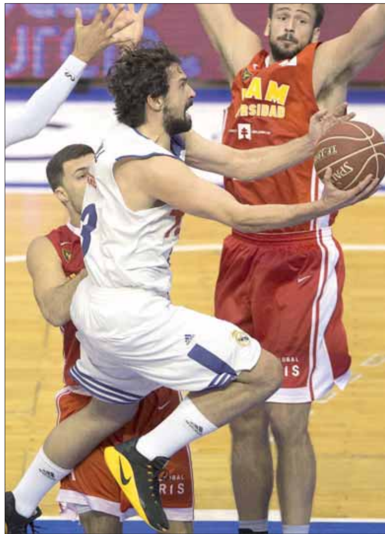
Llull, de nuevo destacado en la victoria del Real Madrid, entra a canasta.

Los de Giorgios Bartzokas, que descienden a la cuarta posición de la tabla y vuelven a ceder (13-5) con el resto de equipos de cabeza,