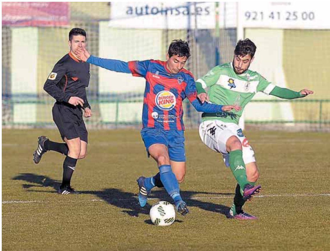
Quino intenta controlar el balón ante la presión de un jugador del Atlético Astorga.

Sin embargo, y como a lo largo de la temporada no todo pueden