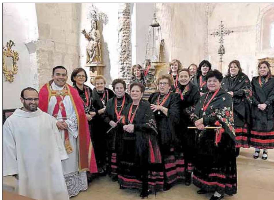
SOTOSALBOS. En la iglesia de la localidad, las aguederas posaron con el párroco.