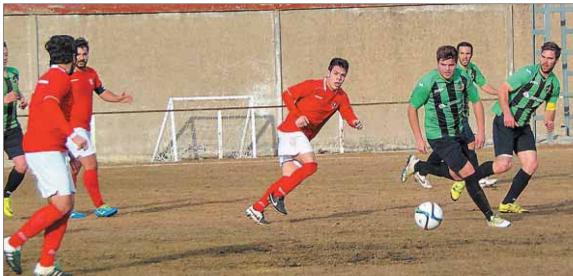
El jugador espinariego César intenta cortar una contra del Venta de Baños.

Los primeros minutos fueron de dominio local y Óscar y después Gabi pudieron adelan-