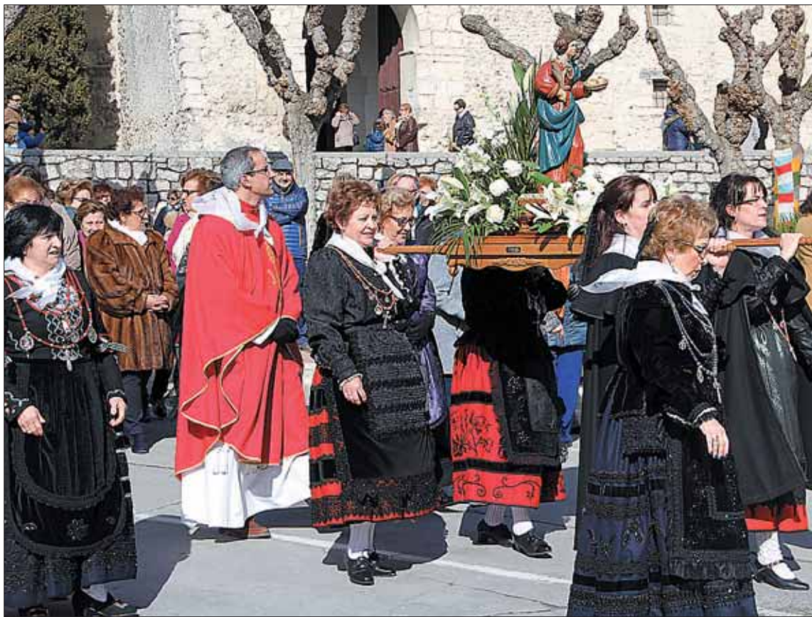
La imagen de Santa Águeda, a hombros de las cofrades, rodeando el templo de El Salvador./ C.N.