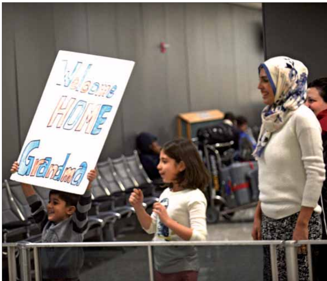
El Departamento de Justicia de Estados Unidos había recurrido este sábado la orden migratoria de Trump.

Hay que recordar que el decreto aprobado por Trump suspende durante cuatro meses las conce-