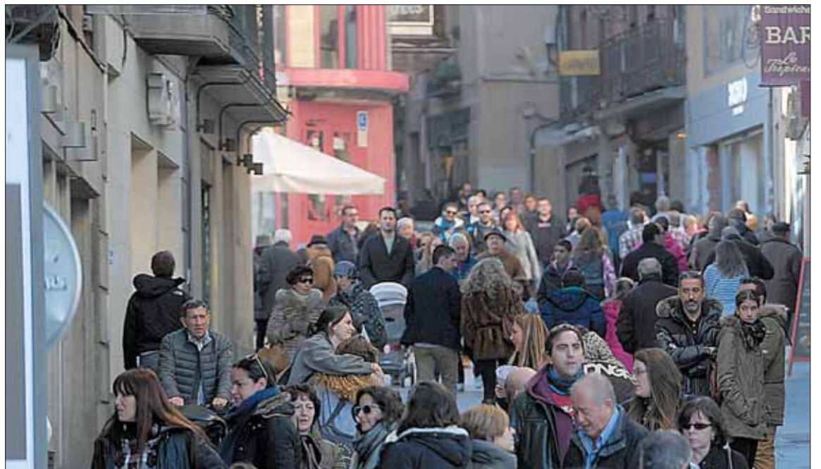
En Segovia hay cerca de 9.000 personas en paro y sólo la mitad percibe algún tipo de ayuda por desempleo.

El carácter temporal sigue siendo predominante, con 4.266 de los contratos firmados; frente a los 369 indefinidos.