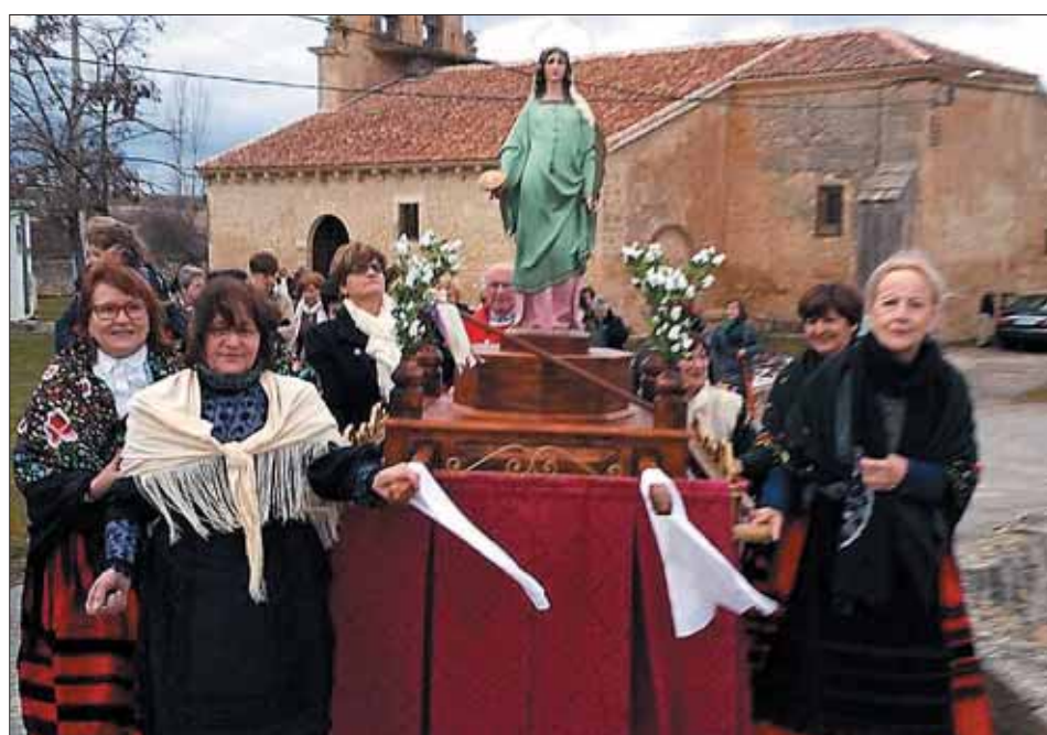
BERCIMUEL. Vestidas con el traje típico, las mujeres sacaron en procesión a su patrona.