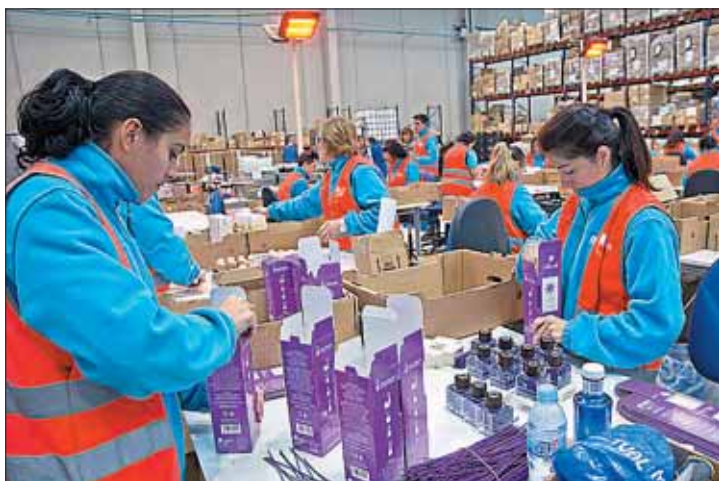
Segovia perdió casi 900 afiliados a la Seguridad Social en enero.

Por último, el informe sobre las prestaciones por desempleo facilitado por el Ministerio de Empleo y Seguridad Social destaca que de las 4.360 personas que percibieron alguna ayuda de este tipo en diciembre, 1.083 eran extranjeros. De ellos, 838 procedían de otros puntos de la Unión Europea y 245, de países extracomunitarios.