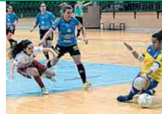
Un momento del partido que jugó el Naturpellet frente al Leis.

Victoria del Naturpellet y derrota del Unami en la Segunda Femenina. PÁGINAS 34