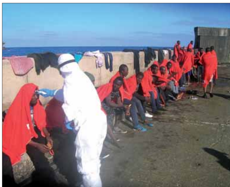
El viaje se hizo parcialmente en horario nocturno y sin medidas de seguridad. / E.P.

La primera de ellas tuvo lugar en mayo de 2013 y en ella participaron 18 personas de origen argelino, a las que se cobró entre 850 y 1.000 euros por una plaza en una lancha neumática de su propiedad, de ocho metros de eslora y dos de manga, en la que también hubo otros colaboradores que se encargaron de dirigir la embarcación con sus indicaciones.