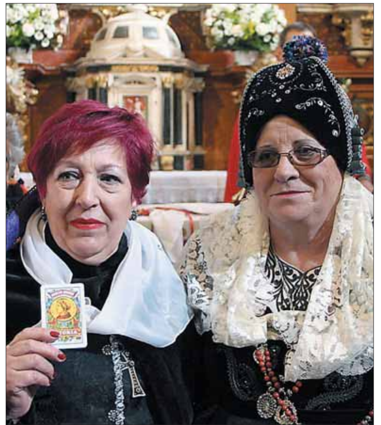
La mayordoma de este año junto a la de 2018, tras el sorteo.