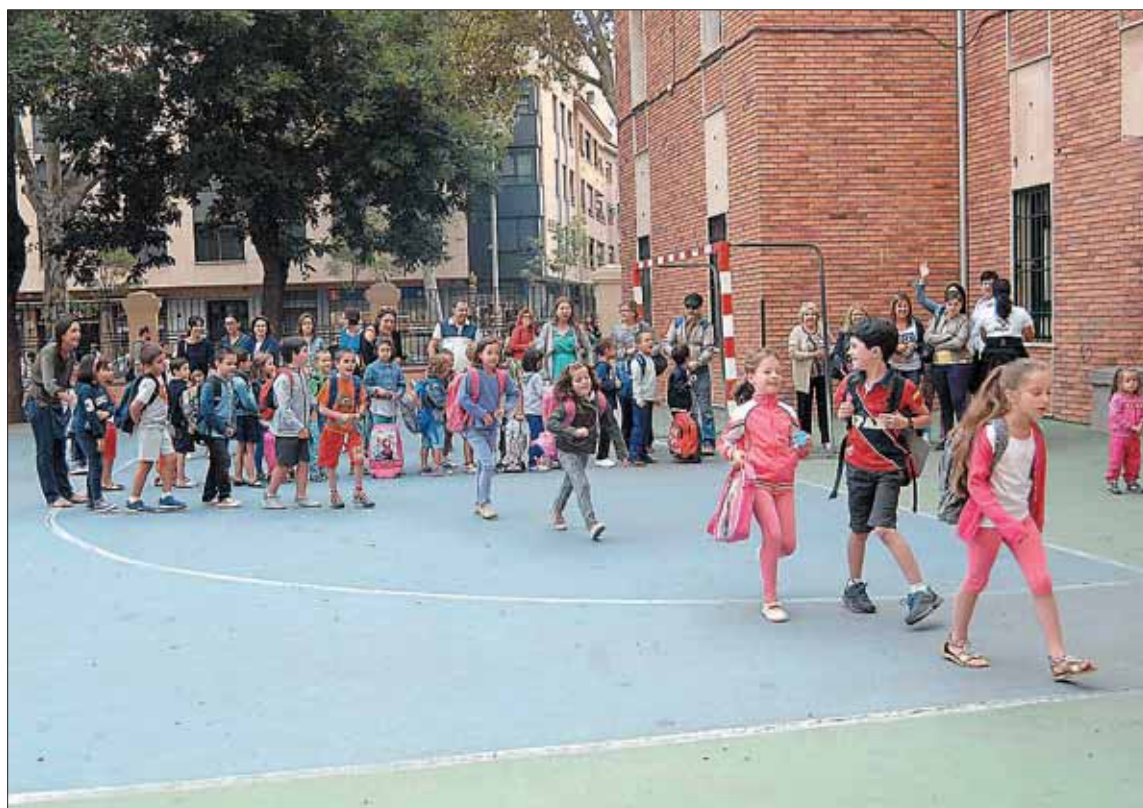
Los alumnos de los colegios participarán en varias experiencias prácticas sobre convivencia.