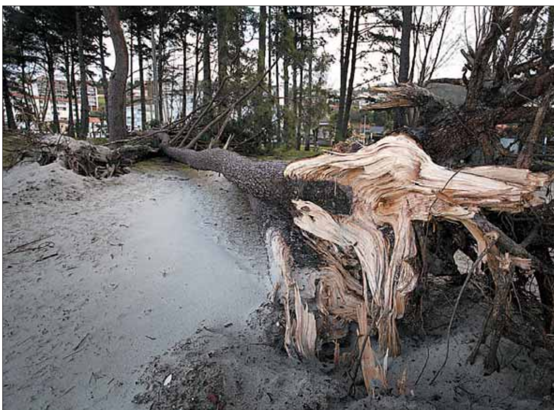
El temporal de viento que comenzó el pasado miércoles ha arrancado y roto árboles a su paso por Castilla y León.

prendidas entre los 17 y los 21 años, resultaron heridos ayer en un accidente en el que se vieron involucrados cuatro turismos debido al granizo y al hielo en el municipio de Pinarejos, según han apuntado fuentes del 112 a Europa Press.