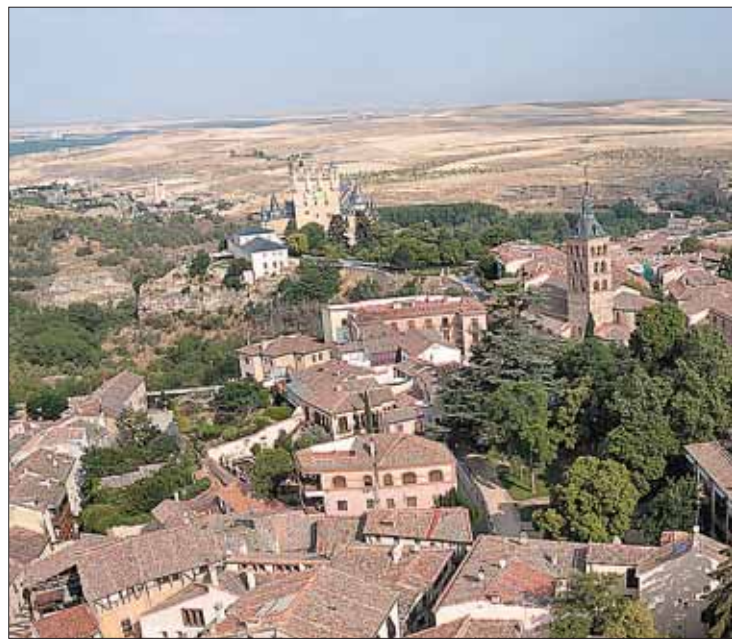
Segovia dorma parte del grupo Ciudades Patrimonio.

En los 10 primeros meses de 2016 han visitado España 2,1 millones de turistas belgas, un incremento del 2,5% con respecto al mismo periodo del año anterior. Además una encuesta realizada recientemente por el Instituto WES para la Oficina Española de Turismo en Bruselas en la que se analiza el posicionamiento de España como destino turístico refleja que el 39% de los belgas tienen intención de viajar a España en los próximos dos años.