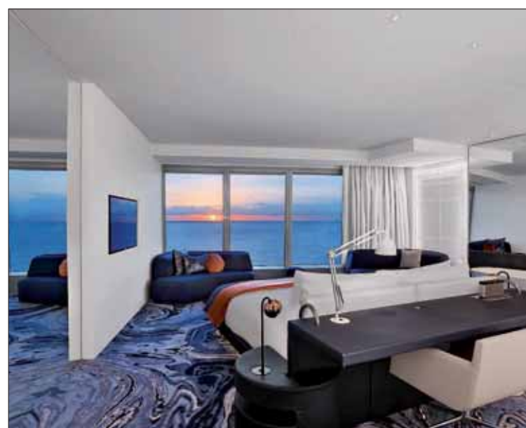
Los hoteles españoles consiguieron una puntuación media de 4,15.

En general, Revinate recomienda a los hoteleros "que sigan aprendiendo del 'feedback' de sus huéspedes" así como analizar qué etapas del ciclo completo de la estancia reciben más comenta-