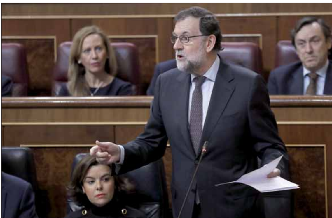
El presidente del Gobierno, Mariano Rajoy, en la sesión del control al Gobierno que se celebró el pasado miércoles.

De esta forma, el próximo 11 de febrero Rajoy saldrá proclamado de nuevo líder del PP, formación que preside desde el 2 de octubre de 2004 cuando sucedió a Aznar. En su primer congreso logró el apoyo del 98,37% de los compromisarios y en 2008, cuando Esperanza Aguirre amagó con disputarle el liderazgo en Valencia, fue apoyado por el 84,24% de los delegados. En 2012, el jefe del