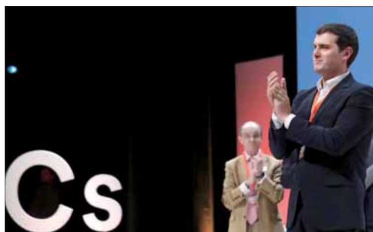
El presidente de Ciudadanos, Albert Rivera.

En relación con el ideario de la formación, una de las pocas cuestiones en las que ha habido algo de oposición interna porque un sector de la militancia no quería eliminar el término "socialismo democrático", señaló que el deba-