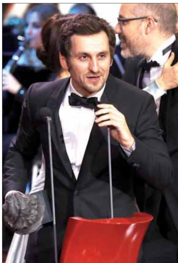
Los directores Raúl Arévalo (i) y Juan Antonio Bayona muestran orgullosos los premios conseguidos en la gala de los Goya.

MADURAR Pese a ello, aclaró que todo el tiempo que transcurrió desde que se inició el proyecto hasta que se ha hecho realidad le ha servido para "madurar" mucho más la película, una cinta que no sabe si ha triunfado porque tiene "alma", algo que afirma su productora. Para Arévalo, es más bien una "cosa mágica" que no se puede controlar. "Siempre he querido ser direc-