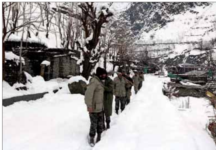
Pakistán y Afganistán están en estado de máxima alerta por las nevadas.

Además, otras 15 personas murieron, entre ellas seis niños,