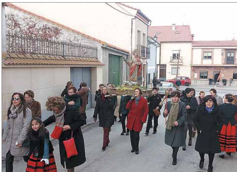
VALSECA. Tras la misa hubo procesión por las calles del pueblo.