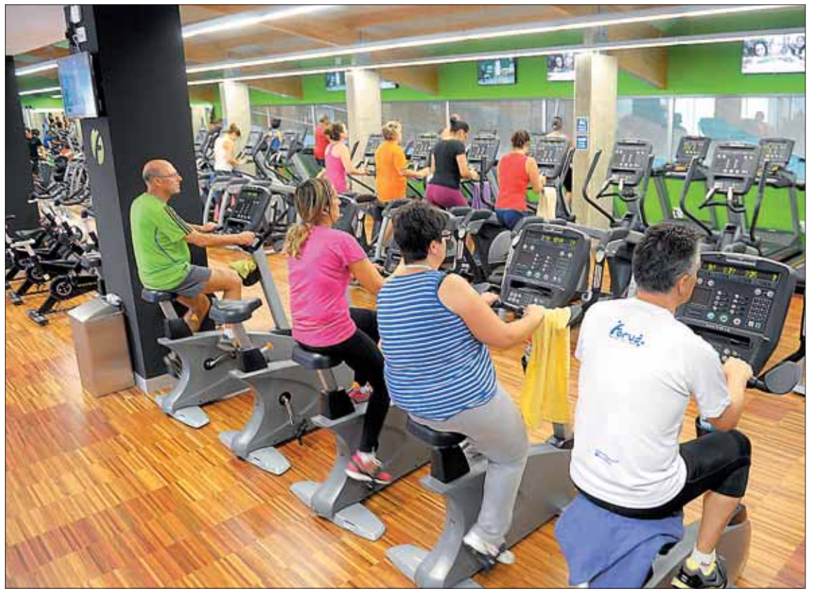
El complejo deportivo Carlos Melero ofrece a los segovianos diferentes propuestas para mantenerse en forma.

LOS PRECIOS Según lo aprobado en la última Junta de Gobierno Local, el abono individual mensual —que incluye el uso libre de todas