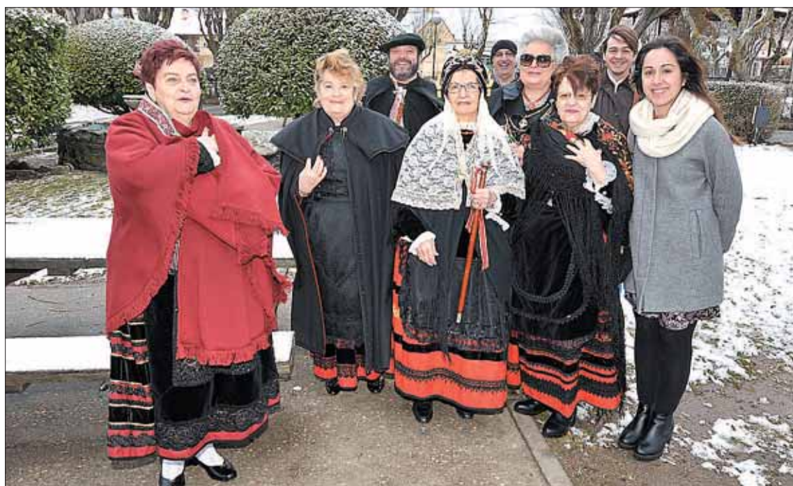
Aguederas de La Estación, donde las calles estaban cubiertas de nieve a la hora de la misa y procesión.

CATÁLOGOS | CARTELERÍA PAPELERÍA corporativa packaging | REVISTAS LIBROS | invitaciones DE BODA | PUBLICIDAD imaginación | DISEÑO