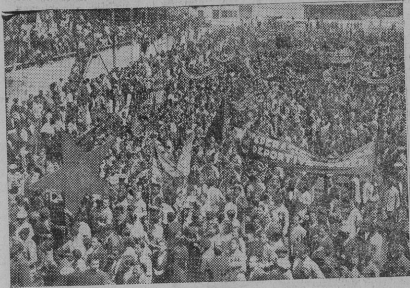
El campo de deportes del Betis en los momentos en que se organizaba la manifestación

Los manifestantes tardaron hora y media en desfilar, sin que se produjera la menor incidencia que desluciera el acto