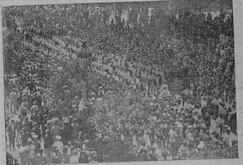
Un aspecto de la manifestación á su paso por la Plaza Nueva, ante el Ayuntamiento

el de Camas y el de Alcalá. De este grupo destacaba un chico con una barretina catalana. La bandera de Gines llevaba un crespon negro.