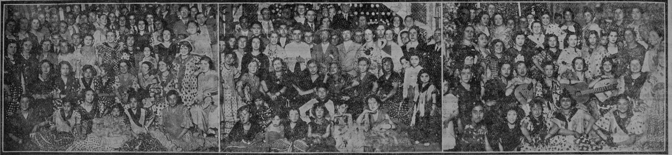
LA COLA DE LA FERIA.—La abundante información sobre los distintos aspectos de la Feria, nos obligó á retardar la publicación de estas fotos, que hoy ofrecemos á nuestros lectores como epílogo de aquélla.