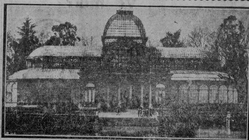
El Palacio de Exposiciones del Retiro, que será habilitado para la asamblea de parlamentarios y compromisarios que conjuntamente elegirán al nuevo Jefe del Estado.