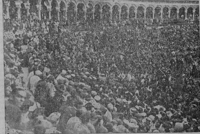
Aspecto que ofrecían los tendidos de la plaza durante el acto

De otro tenemos un presupuesto que hay que cumplir hasta fin de año, con el que nada se puede hacer, pues impiden sus cifras toda liber-