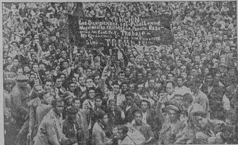
Llegada á la plaza de toros de los damnificados por los temporales, que se hallan actualmente alojados en el pabellón de Maquinaria de la Exposición

En relación con el paro, se refiere al proyecto de veintitanos millones de pesetas para desviación del alcantarillado, que hace varios años que rueda por los ministerios, cuando su realización podía aliviar en gran parte la crisis de trabajo. Califica de vergüenza la devolución al Estado de millones por la Confederación del Guadalquivir, y dice que esos millones deben venir por otro conducto que permita su aplicación