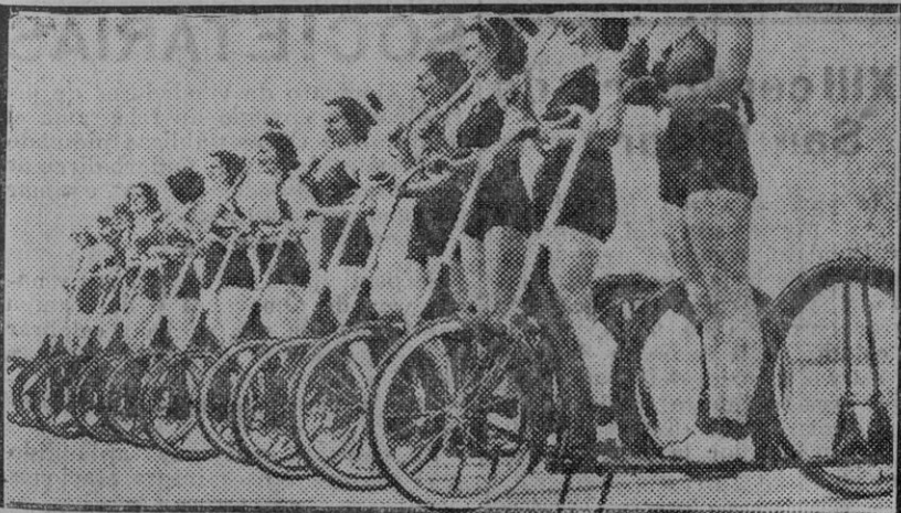
El polo en patinete! Novísima adaptación, creada en Los Angeles, del deporte y el semidesnudismo. Todo muy cinematográfico, como nacido en la Meca del séptimo arte.

«En el correo de Cádiz han salido para dicho capital el jefe de los radicales españoles, don Alejandro Lerroux, y don Manuel Blasco Garzón, con objeto de tomar parte en actos de propaganda.»