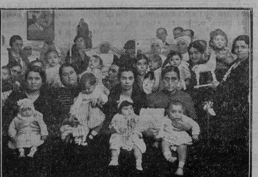
Reparto de prendas y juguetes á los niños acogidos al dispensario de «La Gota de Leche» celebrado en el día de ayer.