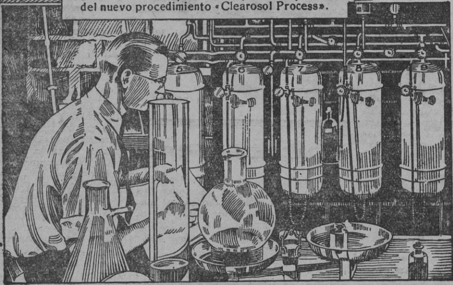
(abajo) Una pequeña refinera en miniatura donde se efectuaron los experimentos para la aplicación del nuevo procedimiento «Clearsol Process».

La VACUUM OIL COMPANY, con su nuevo procedimiento de refinación "Clearsol Process", ha encontrado el medio de obtener lubricantes completamente exentos de las impurezas que ensuciaban los motores, pegaban las válvulas, facilitando la formación de depósitos carbonosos, y que hasta ahora ningún Refinador ha podido eliminar de sus lubricantes ni siquiera de los más caros. El MOBIL OIL agrega así otro título a su primacía absoluta: es prácticamente 100 por 100 puro.