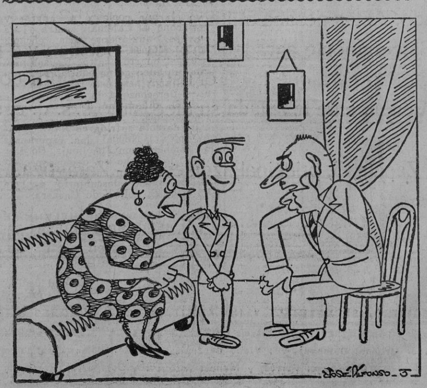
—Este ha salido muy listo. Le gana á su padre muchísimo dinero. —¿Tan pequeño y ya ayuda á la casa? —No; si es que juega todas las noches con su padre á las cartas. ¡Y tiene una suerte!

Este primer patron era Marte, que negara el joven amanecer florentino. Sólo que Dante se equivocó dos pocos suponiendo que los florentinos se liarían la manta á la cabeza en continuas guerras civiles. No. No será su historia un caos de horas turbulentas, sino colmo de dorados días. En las aguas del Arno, el Bautista lava á Florencia de sus culpas, pecado de superficialidad, polémica civil de güelfos y gibelinos. La ciudad sale de las aguas matinal, fresca, sin arrugas ni aire frenéticos, enamorando á medio Occidente, con su serenidad literaria. Con su gracia mercantil é industrial. Florencia literaria y científica. Naves ruidosas quebrando el cristal del río. Sabios con grandezza cósmica. En aquel canto décimotercero está, aunque equivocado, el júbilo del poeta. Esto lo saben todos.