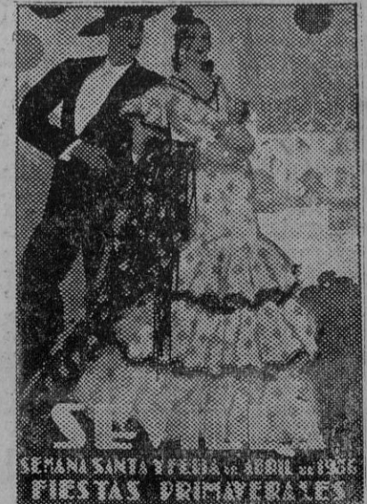
«Viva Triana», cartel premiado, original del notable artista sevillano Enrique Estela.