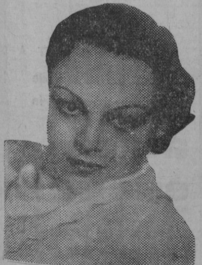
He aquí á la bella artista del cine Katherine de Mille mostrando con gesto sereno su «endiablada» cejas.