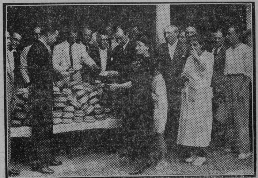
Reparto de pan hecho por la Asociación Benéfico de Socorro Mutuo de la Vejez del Torero en el segundo aniversario de su constitución.

ornamentación ni por su limpieza. Había bajo los entarimados y en los fosos del escenario ratas del tamaño y del año que se quisieran; pero á pesar de todo, los espectadores acudían á él y las