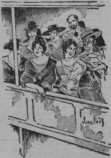
A los delanteros de las gradas iban las «azucenas de carne».

ornamentación ni por su limpieza. Había bajo los entarimados y en los fosos del escenario ratas del tamaño y del año que se quisieran; pero á pesar de todo, los espectadores acudían á él y las