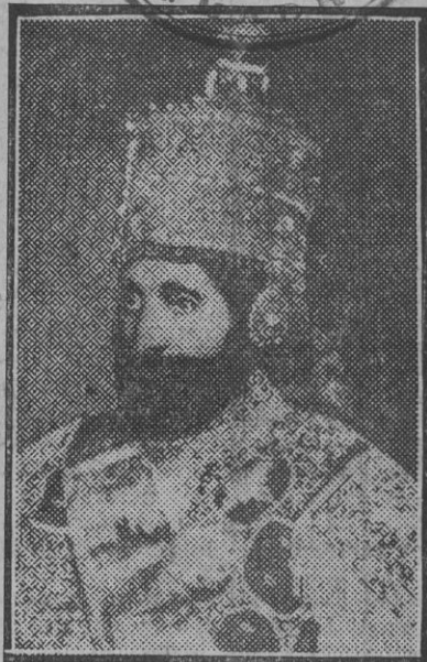
El emperador de Abisinia, Haile Selassie I, en traje de gran ceremonia, con la corona imperial de Etiopía, cuya figura es hoy de relevante actualidad con motivo del conflicto de su pueblo con Italia.

Profesor Noel Baker, de la Universidad de Londres. (Prohibida la reproducción).