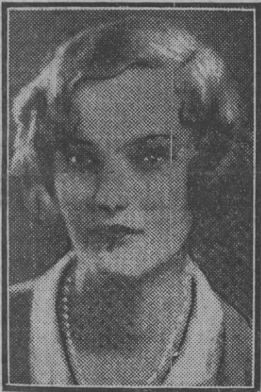
Esta joven de tan lindo palmito que aparece aquí—yanqui, naturalmente—es, según se dice, la más rica heredera del mundo.

Y dejamos sin apostillar las mudas incidencias del día y lo de más hulto atisbado afuera, poniendo punto aquí á nuestro eco, que, ciertamente, decae por falta de rebumbantes resonancias.