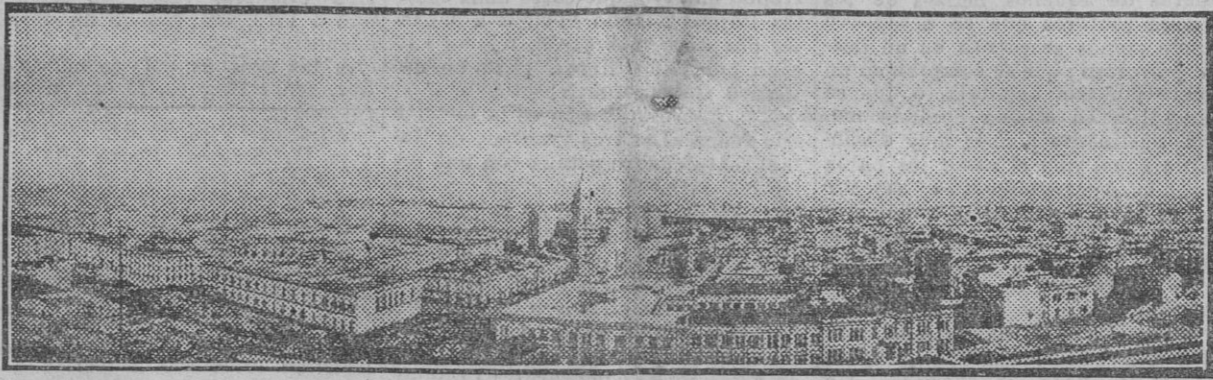
MESSINA.—Representa la foto una vista parcial de Messina, la bella ciudad siciliana tan combatida por los temblores de tierra y que hace algunos lustros quedó medio destruída, resultando numerosas víctimas.