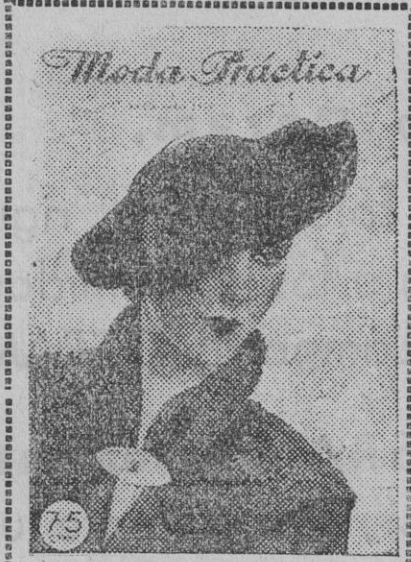
Preciosa portada a todo color de la Revista de Modas