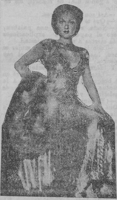
Vistoso vestido de sociedad completamente bordado de lentejuelas, que presenta en esta fotografía Grace Bradley.

¿Qué espera usted, caballero? La vuelta; no ve que le he dado diez céntimos?