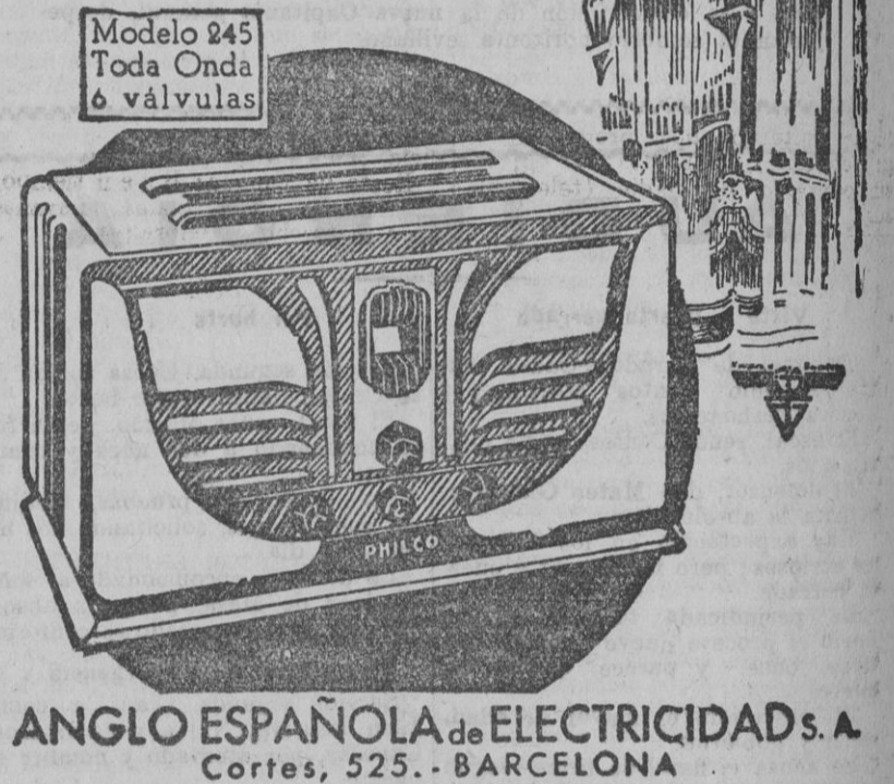
ANGLO ESPAÑOLA de ELECTRICIDAD S. A. Cortes, 525 - BARCELONA

Esta es la denominación que ha merecido este nuevo modelo PHILCO de 6 válvulas para onda completa, gigante por todas sus maravillosas cualidades de recepción fiel y potente, y gigante asimismo por la belleza de su mueble, de nuevas líneas de original estilo.