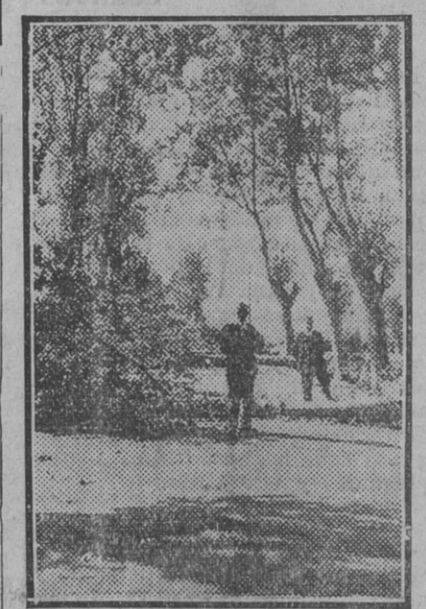
Arboles cortados por los revolucionarios para interrumpir la carretera de Oviedo

—Salí el día 5 por la mañana de Oviedo con dirección a Grado, en viaje de recreo—se trataba sencillamente de aprovechar un kilómetro—; pero al llegar el coche a Grado—el trayecto Oviedo-Grado lo ha-