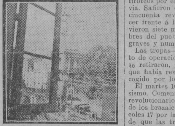
Casa donde estuvo instalado el Comité Central Revolucionario

Con los primeros bandos fijados el miércoles se había declarado ya oficialmente el comunismo libertario, declarándose abolida la propiedad privada. Se habían colocado guardias con camisetas y brazaletes rojos en todas las esquinas y en las salidas del pueblo. Como medida de precaución los revoltosos trataron