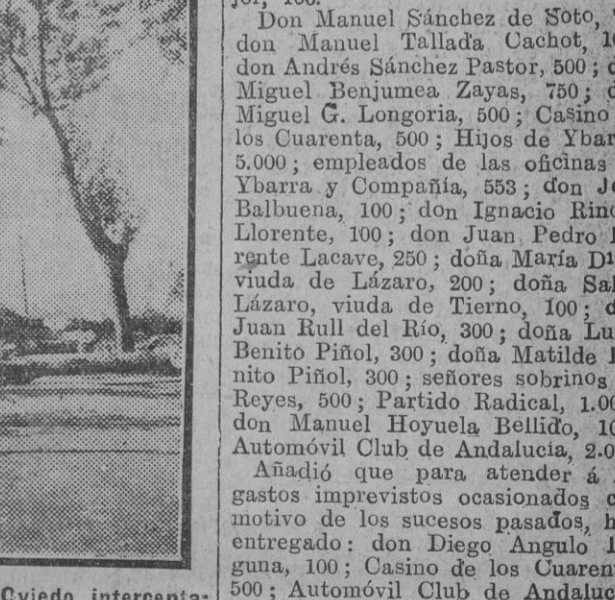
La carretera de Oviedo interrumpida por los árboles caídos

El martes 16 se acentuó el nerviosismo. Comenzaron a despojarse los revolucionarios de las camisetas y de los brazaletes rojos, y ya el miércoles 17 por la noche llegó la noticia de que las tropas gubernamentales se habían apoderado de Trubia, produciéndose la desbandada de los rebeldes. Estos abandonaron los fusiles en medio de las calles y en las afueras del pueblo. Los que eran vecinos de Grado se refugiaron en sus casas y los restantes huyeron por