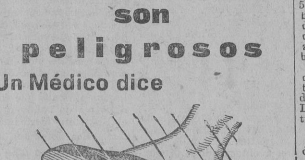
Lo que debe Vd. hacer