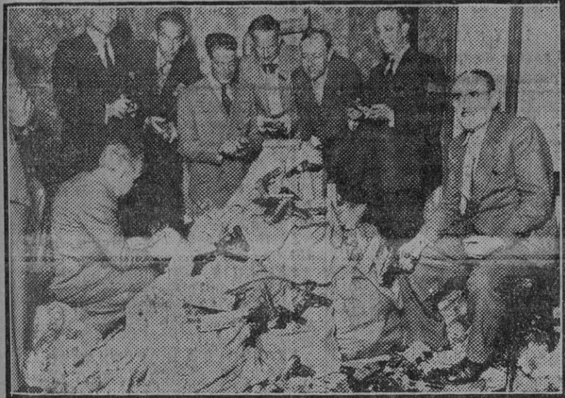
MADRID.—La Policía con las 616 pistolas y 80.000 cartuchos encontrados durante un registro en una casa de los Cuatro Caminos.

Lituania es uno de los tres Estados bálticos que se desgajaron después de la guerra del imperio de Rusia, recabando su independencia política. La parte del territorio lituano en la cual hallase Vilna, la antigua capital, integra hoy la gran Polonia, con profundo sentimiento del clásico nacionalismo lituano, que no puede olvidar a su célebre ciudad histórica.