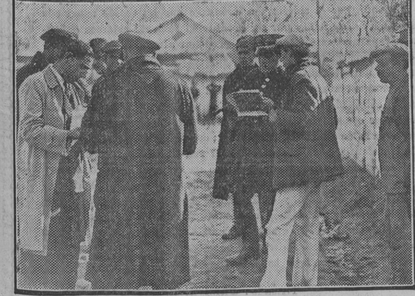
La fuerza de Asalto realizando varias investigaciones en Amate, después del sangriento suceso ocurrido en las primeras horas de la mañana.