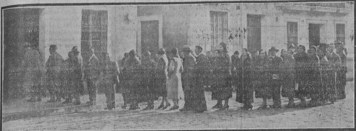
Cola en el colegio de la calle Pastor y Landero.

Un muerto, tres heridos y varios contusos en las incidencias ocurridas