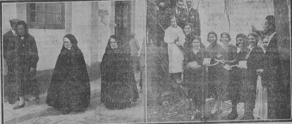
Religiosas saliendo emitir su voto del colegio instalado en las escuelas de la calle Oriente.—Grupo femenino del barrio del Porvenir.

En la Comisaría de Vigilancia se recibió aviso a las cuatro de la tarde de que habían sido rotas las urnas electorales en un colegio de la calle Arrebolo y en otro de la calle Luna. El autor de la rotura de esta última fué trasladado a los calabozos de la Comisaría.