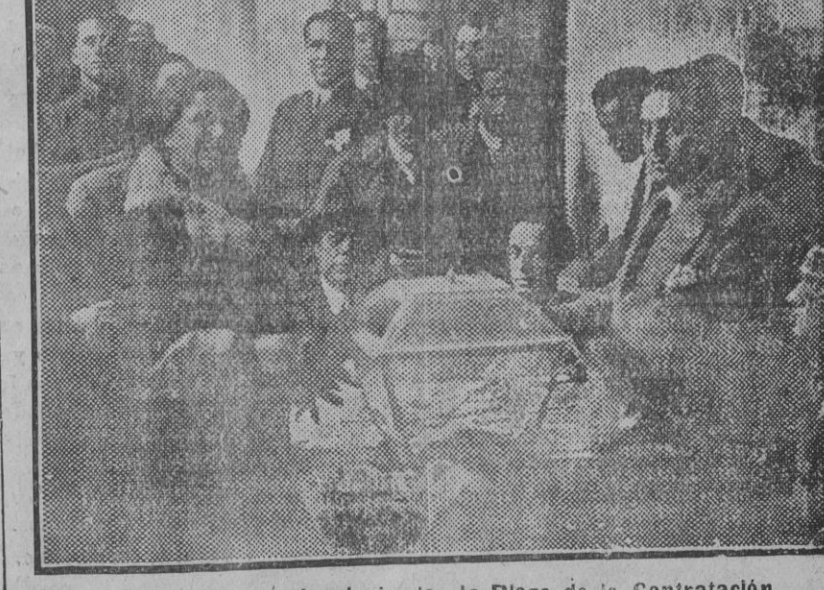
Una electora en el colegio de la Plaza de la Contratación.