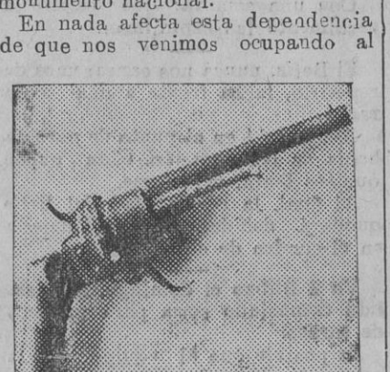
¡La «browning» de aquellos tiempos! ¡Pobres guardias!

¡Nada más que esto les colgaban a los guardias de caballería!