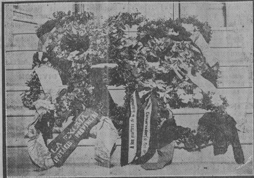
Los mártires de la Independencia tuvieron estas ofrendas sobre sus tumbas, y las guardaron, sin duda, para el próximo centenario.

Ya hemos dicho que la lista de los objetos que se guardaban en el guardarropas municipal ocuparía mucho espacio; pero algunas cosas