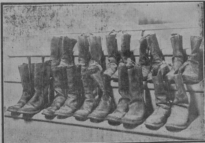
Mientras hay empleados que pisan con el contrfuerte, en el guardarropas existe esta zapatería.