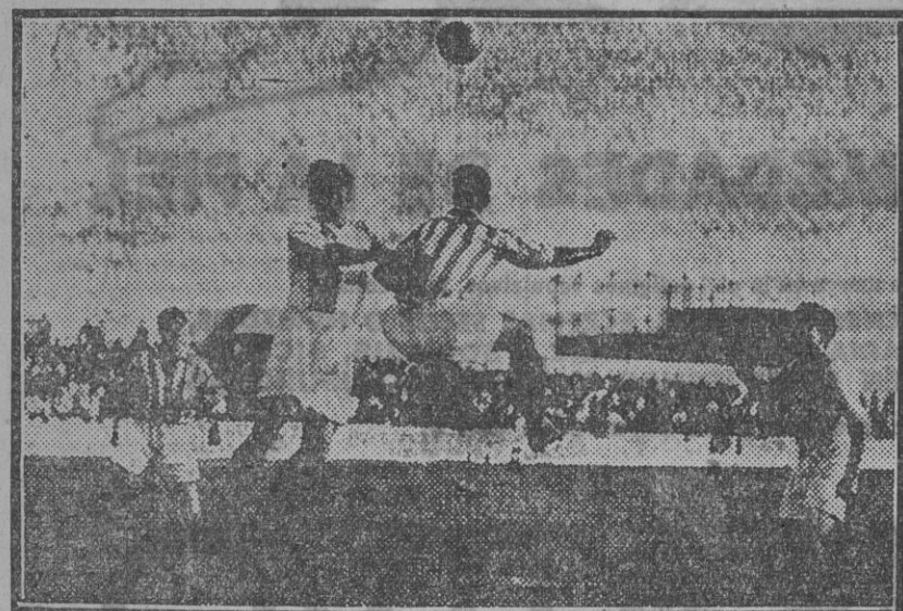
Ochandiano despeja una situación apurada