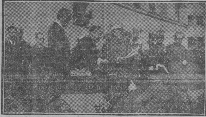
MADRID.—Reparto de premios a la Guardia civil por el Presidente del Consejo de ministros en la fiesta celebrada en Cuatro Caminos

Estos actos tendrán lugar del 8 al 10 de Noviembre.