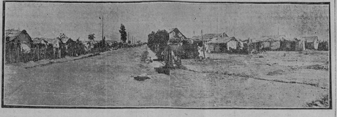
La Quinta Avenida de Amate.—Una calle de las que van quedando en cruz y en cuadro.—Ese enorme solar estuvo hasta hace muy poco poblado de viviendas.—Han desaparecido de aquí más de cincuenta chozas.