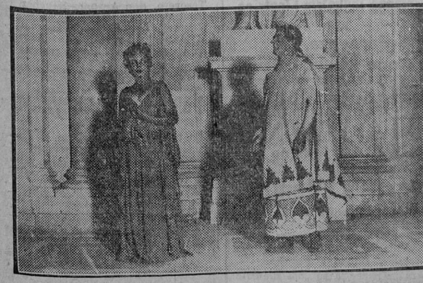
La Xirgu y Borrás representando «Medea» en la Plaza de la Armería, con resonante éxito.