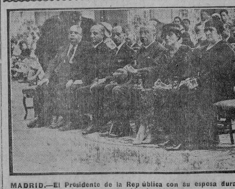
MADRID.—El Presidente de la República con su esposa durante la presentación de «Medea».