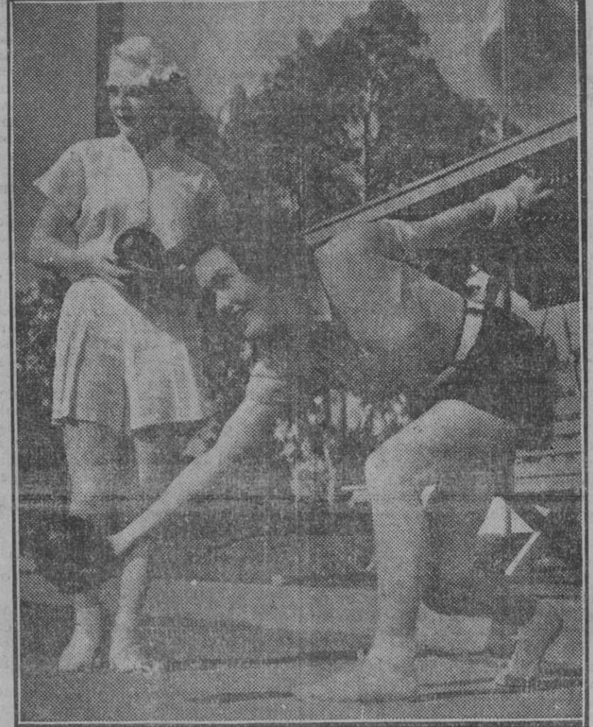
Este cómodo y nuevo modelo, que ha obtenido gran aceptación entre las artistas cinematográficas, compuesto de calzón de anchas perneras y blusa ó jersey de mangas cortas, lo lucen en estas fotografías Maurreen O'Sullivan y Ruth Channing.

A todo eso EL LIBERAL, en cuya casa se recibe a todos los que la pisan con el mismo cariño, y en donde la escrupulosidad por no lesionar intereses legítimos de nadie es tan grande, que basta, para comprobarlo, ver en cuántas y diversas manos esta siempre EL LIBERAL y revisar cualquier día el correo que llega a nuestras manos, cuajado de peticiones, de insinuaciones familiares, de efusivas palabras de toda clase de lectores.