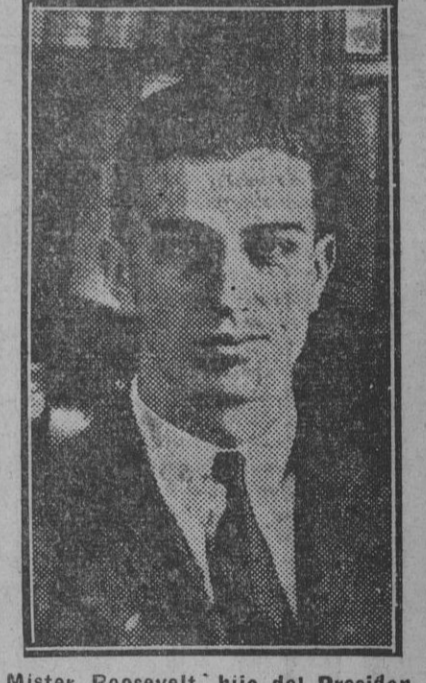
Mister Roosevelt, hijo del Presidente de los Estados Unidos, que ha llegado á Madrid.

Probablemente, para fines de la semana actual marchará á Madrid la representación sevillana que va á entregar al jefe del Gobierno las fórmulas económicas mediante las cuales, y con la aportación del Estado, el Municipio podrá salvar la gravísima crisis económica que hoy yugula sus actividades y le imposibilita en absoluto para toda acción.