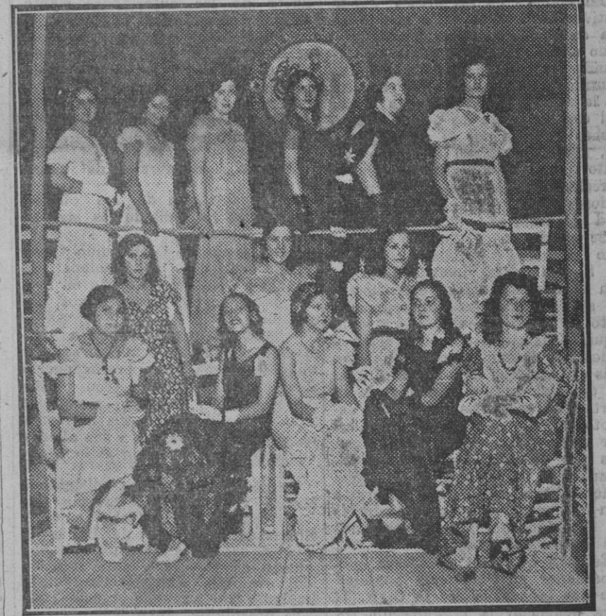
Muchachas granadinas que toman parte en el concurso de vestidos baratos, organizado por nuestro colega «El Defensor de Granada», y en el cual se han inscrito numerosas granadinas.