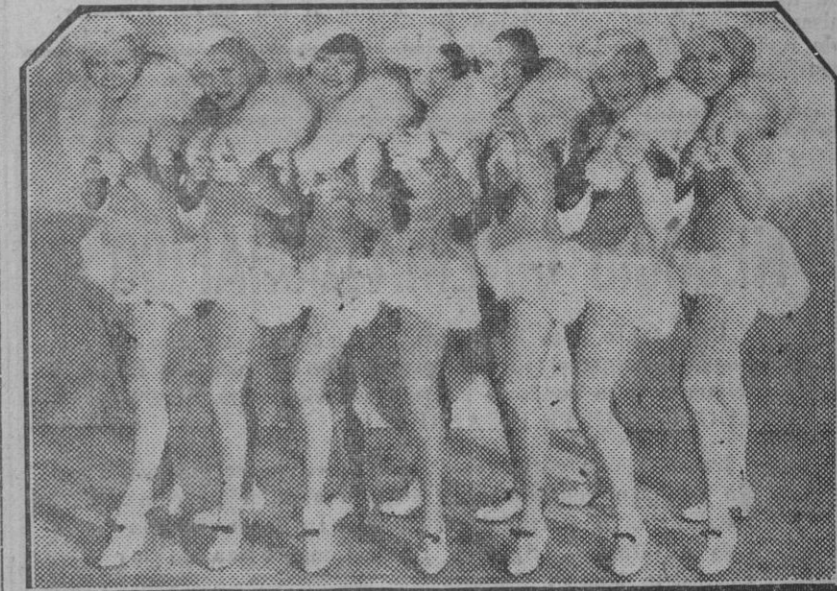
Otro momento placentero del cinema: lujosos y breves vestidos y muchachas jóvenes y bonitas, en la que tan pródiga es la joven América: luz, jazz-band, alegría.