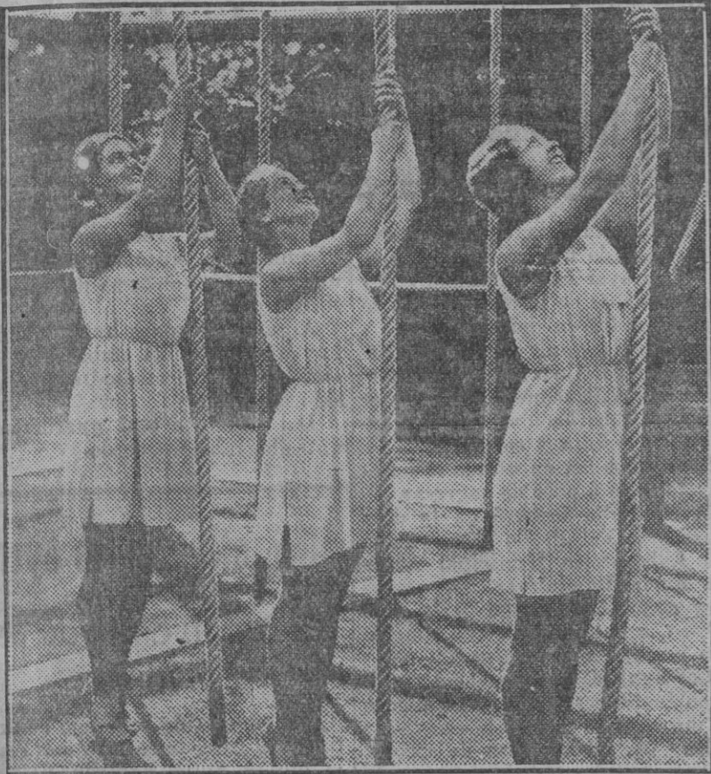
Muchachas finlandesas en una prueba del concurso de gimnasia que se celebra anualmente en Sturry (condado de Kent), entre estudiantes ingleses y escandinavos.

Seguimos recibiendo adhesiones de los Ayuntamientos de los pueblos a nuestra campaña sevillanista, que agradecemos en lo mucho que valen. La intervención de los pueblos constituirá la segunda etapa de los trabajos actuales de Sevilla por librarse de la actual situación. Todos ellos envían telegramas al Presidente de la República y al Gobierno. En todos se advierte el ansia de vivir, siquiera con un ritmo normal. Cuando la primera parte de la actividad sevillana haya tenido efecto, será ocasión de reunir a los alcaldes de los pueblos para que, a su vez, designen una representación que, con otros elementos importantes de la provincia—Sociedades de producción y obreras—, realicen el mismo acto que se proponen realizar ahora las autoridades, las fuerzas vivas y los diputados de Sevilla. También en esos pueblos ha reaccionado bien la opinión. El sacrificio enseña mucho. Tanto, que a veces produce la salvación en un arrebato. Es admirable el espíritu abnegado de esos buenos hijos de Sevilla que sólo cuando la capital ha vibrado se han atrevido a contar sus cuitas y a abrir los brazos para pedir auxilio!