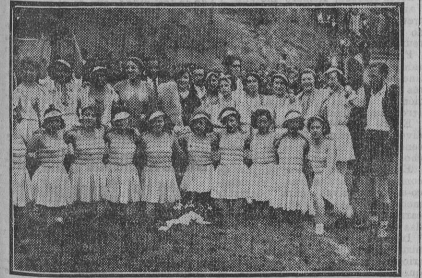
MADRID.—Las vicetiples de los teatros madrileños, que celebraron un partido de fútbol. (Foto. Díaz Casariego.) (Fdo. Gori.)