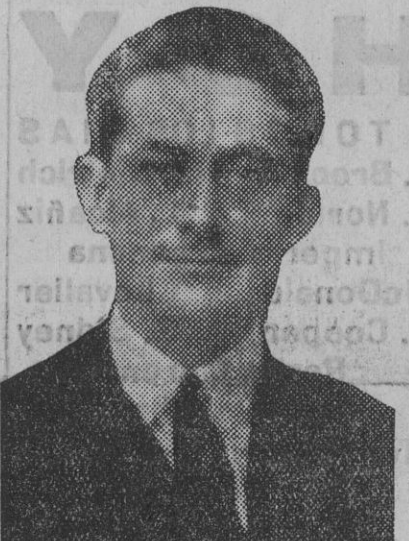
D. RAMON SANCHEZ PIZJUAN. Actual presidente del Sevilla F. C.