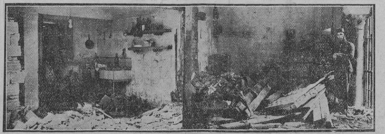
Dos aspectos del estado en que quedaron las habitaciones el portero de la casa del señor Ybarra, después de la explosión