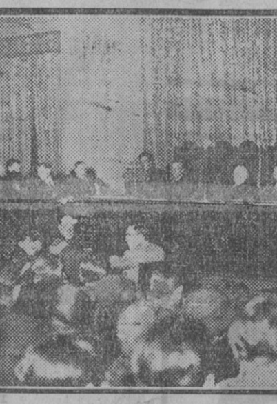
MADRID.—Sesión celebrada por el Colegio de Abogados para conmemorar aniversario de su fundación. (Fdo. Gori.)