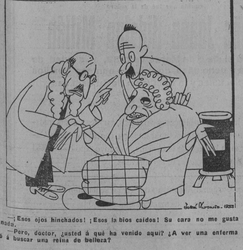
—Esos ojos hinchados!; Esos los bios caídos! Su cara no me gusta nada. —Pero, doctor, ¿usted a qué ha venido aquí? ¿A ver una enferma ó a buscar una reina de belleza?

Berlín.—El número de quiebras en Alemania se elevó en el mes de Febrero a 475, contra 539 en el mes de Enero. El número de suspensiones de pagos fué de 179 contra 194.