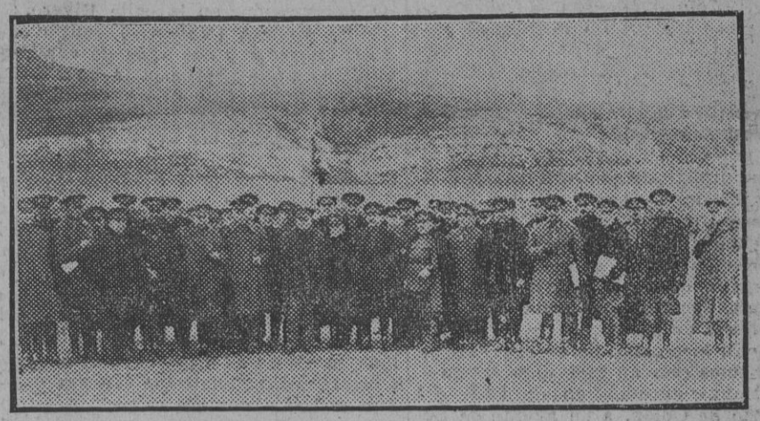
Madrid.—Las autoridades militares presidiendo el curso de coroneles que actualmente se celebra.