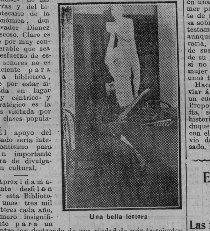
Una bella lectora

La americana al brazo, libre el gazarote del implacable cuello opresor, recibimos con satisfacción íntima una agradable sensación de bienestar, que incita al sueño.