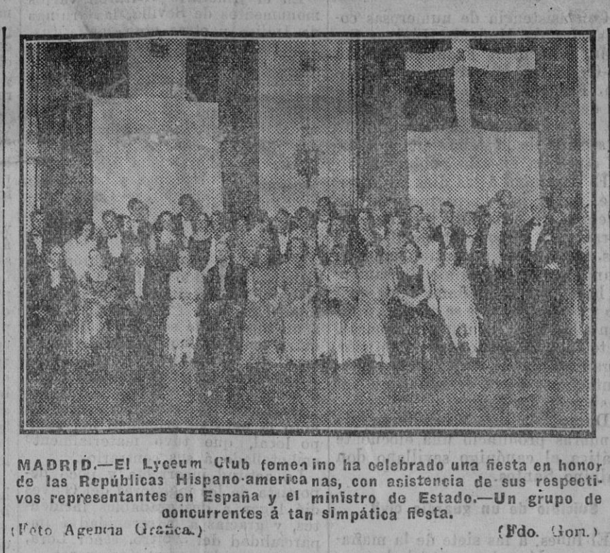
MADRID.—El Liceum Club femenino ha celebrado una fiesta en honor de las Repùblicas Hispano-americanas, con asistencia de sus respectivos representantes en España y el ministro de Estado.—Un grupo de concurrentes a tan simpática fiesta. (Foto Agencia Gracica.) (Fdo. Gor.)