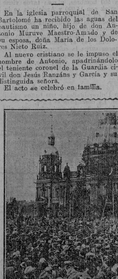
La Catedral de Berlín rodeada de una muchedumbre de comunistas el 1.º de Mayo pasado