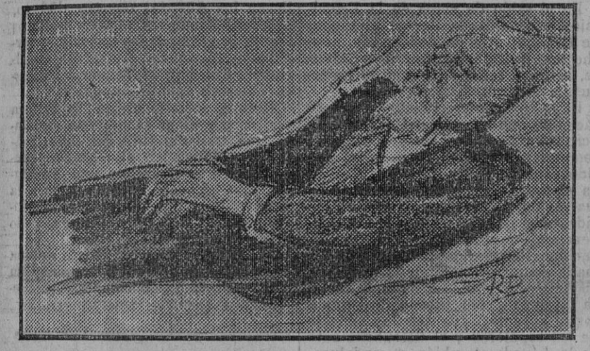
LA MUERTE DEL PRESIDENTE DE LA REPUBLICA FRANCESA Apunte ejecutado por el artista francés, de paso en Sevilla, M. René de Graeve

LEA USTED MAÑANA «EL LIBERAL» EL DIARIO MEJOR INFORMADO (Fdo. Gori.)