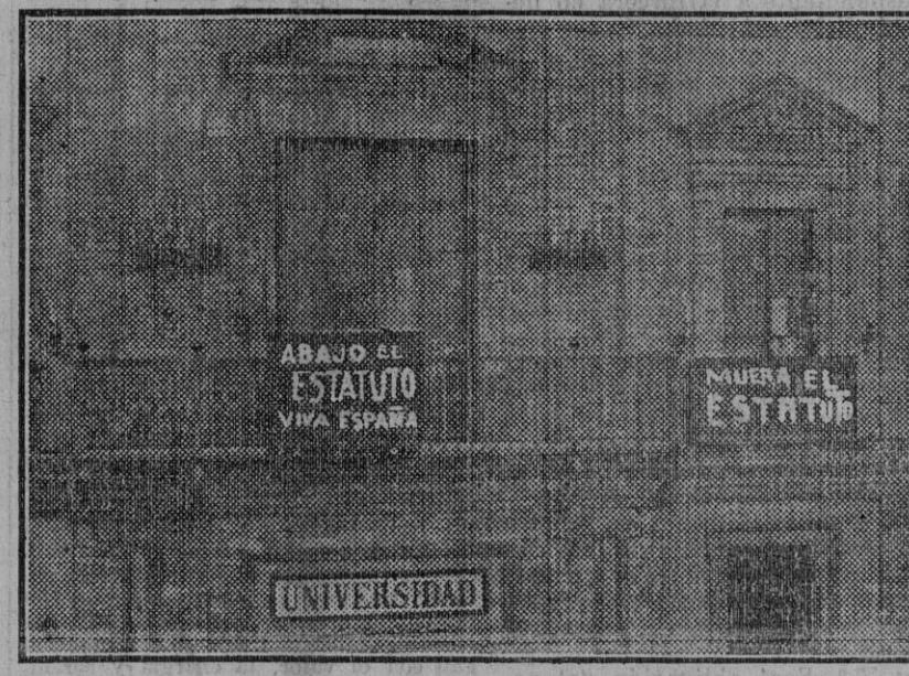
Cartelones que los escolares fijaron en los balcones de la Universidad.

La actitud adoptada ayer por los estudiantes, como protesta por la promulgación de un decreto que ellos consideraban perjudicial, ha sido mantenida hoy, no celebrándose las clases en ninguno de los Centros docentes de la capital. En las primeras horas de la mañana los estudiantes protestaron tumultuosamente contra el proyecto de Estatuto catalán, registrándose incidentes en algunos Centros. En el Instituto los alumnos salieron a la calle, pretendiendo organizar una manifestación. Avisados los guardias de asalto, éstos se presentaron rápidamente en la calle Amor de Dios, no siendo necesaria su intervención, pues los manifestantes se dispersaron, dirigiéndose en pequeños grupos hacia la Universidad. A dicho Centro habían llevado ya estudiantes de Medicina, Comercio y Normal de Maestros. Todos juntos arrojaron en sus protestas, dando vivas a España única y mueras a Maciá y al Estatuto. En las puertas de la Universidad habían colocado los estudiantes grandes cartelones, con inscripciones alusivas al motivo de sus protestas. Varios grupos de estudiantes se estacionaron en la calle Laraña, y mientras unos detenían a los vehículos que pasaban por aquel lugar, otros con tizas pintaban letreros contra el Estatuto y Maciá. También las distintas aulas de la Universidad quedaron repletas de letreros escritos con tiza. Las fuerzas de Seguridad estuvieron ante el edificio desde el primer momento, sin que intervinieran para disolver a las manifestantes.