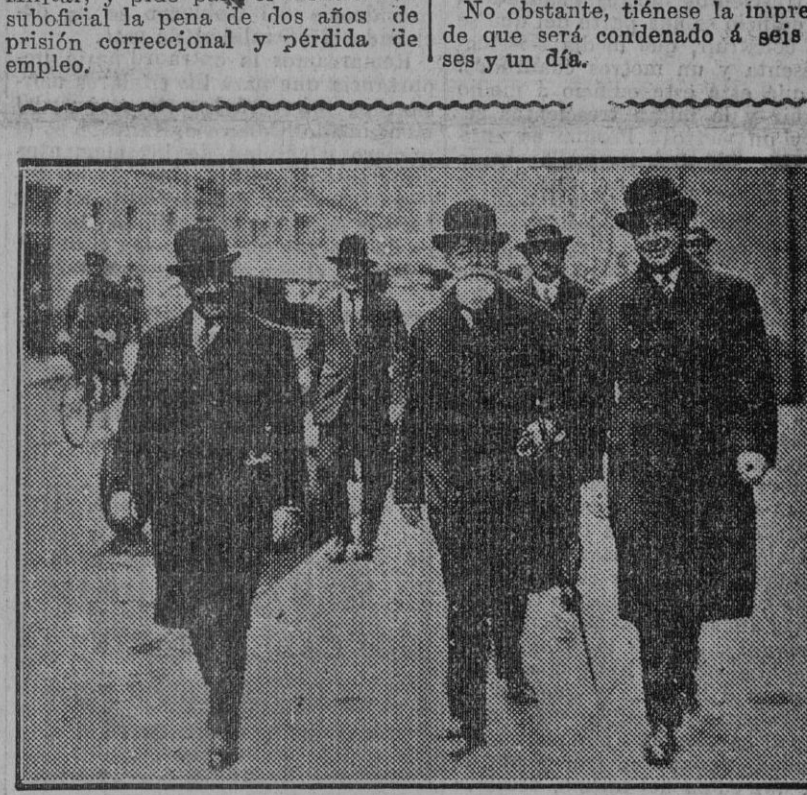
M. Doumer dirigiéndose a votar el día 1.º de Mayo, acompañado por el servicio secreto