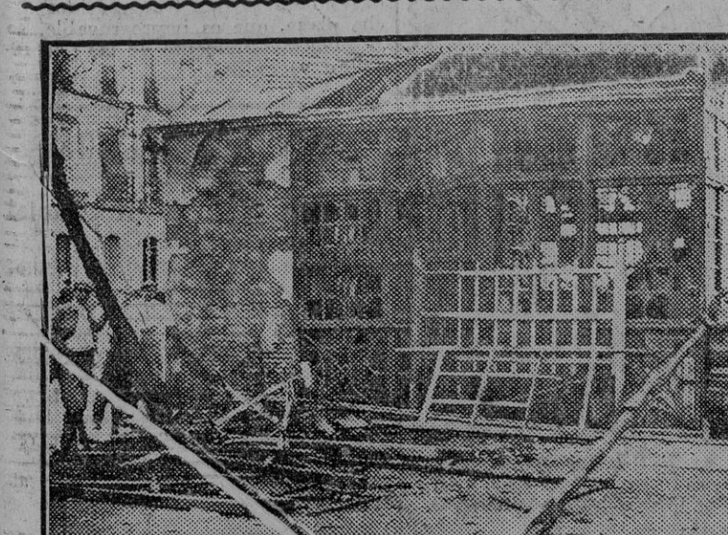
Estado en que ha quedado el kiosco incendiado anoche en la Alameda