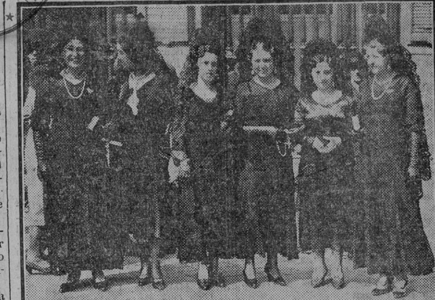
Grupos de bellísimas madrileñas visitando los templos en la tarde del Jueves Santo

En un automóvil que regresaba a Jerez de Sevilla, fué recogido el lesionado y conducido a Jerez, recibiendo asistencia en la casa de socorro de la calle Arcos de dicha población. Allí fué curado de una herida contusa en la región frontal y de erosiones en la misma y dedo índice de la mano izquierda, de pronóstico leve.