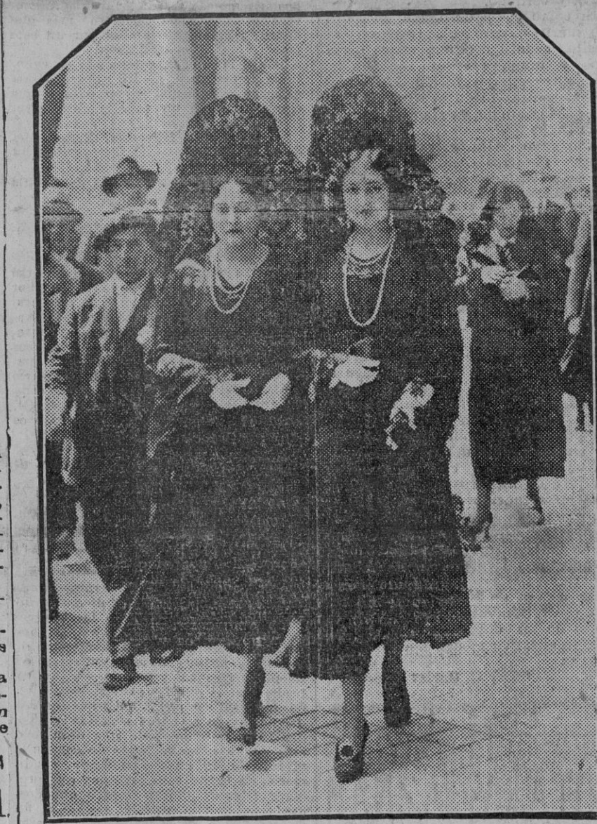
El Jueves Santo en Madrid.—Bellas madrileñas recorriendo las estaciones

En un automóvil que regresaba a Jerez de Sevilla, fué recogido el lesionado y conducido a Jerez, recibiendo asistencia en la casa de socorro de la calle Arcos de dicha población. Allí fué curado de una herida contusa en la región frontal y de erosiones en la misma y dedo índice de la mano izquierda, de pronóstico leve.