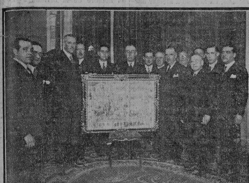
La Junta Directiva del Centro Mercantil entregando al gobernador civil el pergamino que le ha dedicado la entidad.

Que un hombre depravado levante su mano sacrilega en contra de una vida humana, en manera alguna significa que determina número de hombres tenga el derecho de matar al asesino, puesto que la muerte tan sólo corresponde a Dios, y no puede ser un medio para uso de la criatura.