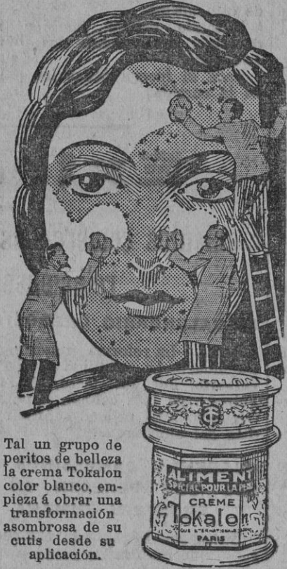
Tal un grupo de peritos de belleza la crema Tokalon color blanco, emplea a obrar una transformación asombrosa de su cutis desde su aplicación.