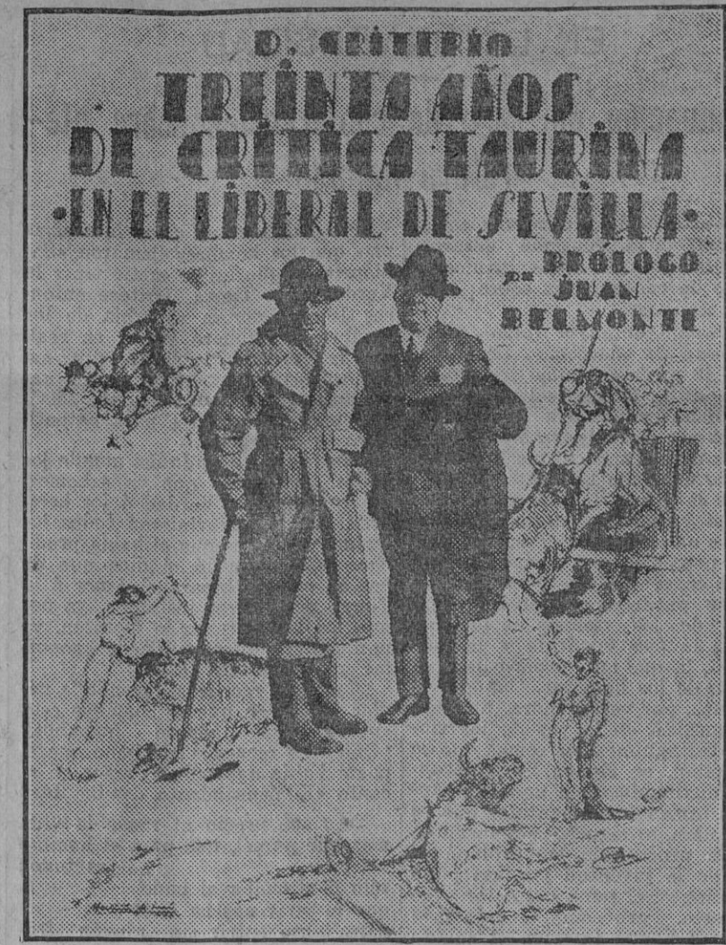
Facsimil de la portada del libro de nuestro compañero «Don Criterio» que aparecerá el próximo jueves.

El bienestar de su familia siempre será incompleto mientras Ud. no adopte LA CALEFACCION IDEAL CLASSIC FOLLETOS GRATIS Industrias Guillén S. A. Resolana, 29-Sevilla