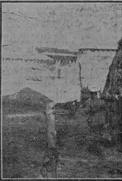
Sitio donde huyeron los ladrones y donde han sido encontradas 22 monedas de á cinco pesetas que perdieron en la huida.

Rufina de los Reyes fué trasladada en un automóvil á la casa de socorro de Triana, donde el personal de guardia le apreció fuertes contusiones en la cara y en un ojo, equimosis en los tobillos y en las muñecas y otras lesiones que le causaron á golpes y patadas.