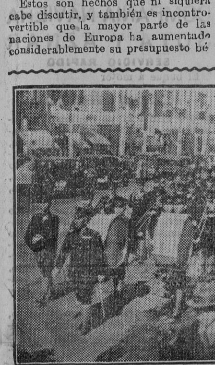
Las tropas japonesas después de la toma de Mukden, desfilando por la población. (Foto. Agencia Gráfica), (Fdo. Gori.)

de modo especial, pero también otros países, sienten la preocupación agobiadora de su propia seguridad. Esta es la situación, á la cual tenemos que hacer frente sin demora ni vacilación, y es el mayor obstáculo al desarme, porque esas naciones creen sinceramente que su seguridad depende del tamaño y de la potencia de sus armamentos. Lo que nos permite, sin embargo, concebir un poco de esperanza, es el hecho de que empezamos a reconocer lo mucho que ha hecho para afianzar su seguridad la Sociedad de las Naciones. Aunque se hallan todavía lejos de concebir toda la importancia que realmente entrañan el Pacto Kellogg, á los Tratados de Locarno, y á otros convenios menos famosos, pero también eficaces, tales como el que se refiere al apoyo financiero en momentos de apuro.