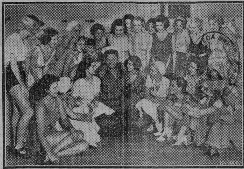
He aquí á Wallace Beery, olvidado del mundo y de sus glorias, rodeado del grupo de bailarinas, con el que hizo una de sus más famosas películas.