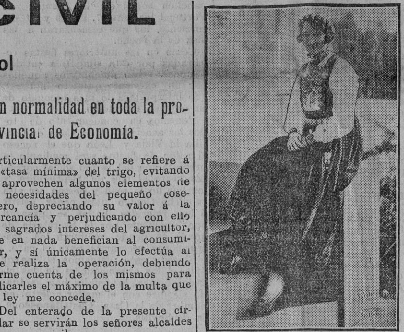
LA ESPOSA DEL PRINCIPE OLAF. La princesa real Marta de Noruega, esposa del príncipe heredero, revestida con el traje nacional, en su casa de Oslo.

Hay preparadas varias unidades para zarpar al primer aviso.—Se prevé la ocupación de Tien-Tsin y Pekín por los japoneses. Londres 22.—Telegrafían de Pekín al «Daily Express» que las autoridades navales japonesas no ocultan que en la base naval de Sansuebug hay dos divisiones y una docena de navios que están preparados para zarpar al primer aviso. En los círculos militares y navales se llega a prever la ocupación de Tien-Tsin y Pekín por los japoneses.