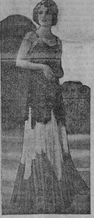
ANITA PAGE La celebrada estrella de cine, luciendo una principessa «toilette» para la noche. El armonioso modelo es de terciopelo negro, y su pollera, larga, como lo exige la moda, termina en una franja de riquísimo encaje de Atenon y tul negro. Un broche y un brazalete de diamantes son el complemento del modelo.

quier estadista debería exigir ante todo. La primera es que las necesidades más urgentes y supremas de la nación sean cubiertas, en primer lugar y sobre todo, por los que más y mejor pueden hacerlo. La segunda es que en cuestiones financieras, y de modo especial para equilibrar el presupuesto, el Gobierno no esté sometido a la dictadura de los jefes políticos ni de los banqueros. Cuando se pretende ejercer tal presión, ejercer semejante dictadura, el deber de los que han de responder ante el Parlamento consiste en resistirse a acatarla. Más aún: en aceptar el riesgo que pueda entrañar un llamamiento al apoyo de la nación. Este llamamiento pudo hacerse sin recurrir a las elecciones. Pudo hacerse proclamando sin disfraz la realidad de los hechos. Nadie me negará, porque es indiscutible, que tanto los banqueros como los jefes de los partidos políticos de oposición estipularon determinadas economías—en primer lugar una reducción del subsidio a los más pobres—a cambio de su apoyo. J. R. Clynes. Ministro de la Gobernación en el Gabinete inglés dimisionario. (A. L. T. E. A.)—Servicio exclusivo en Sevilla para EL LIBERAL.