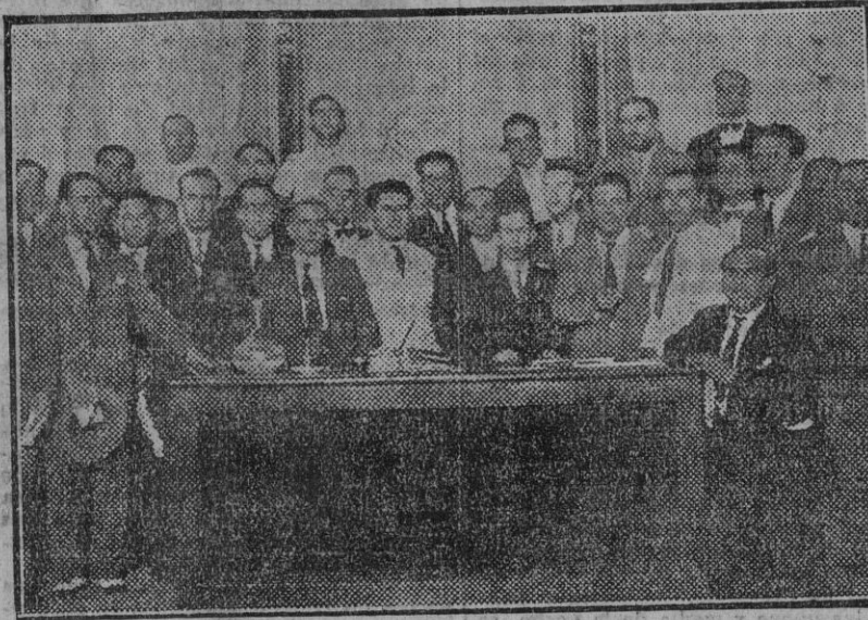
Asamblea del partido socialista para dar cuenta de la labor realizada por sus representantes parlamentarios (Fdo. Gori.)

J. Fernández Pesquero. Chile.—Alrededor de América