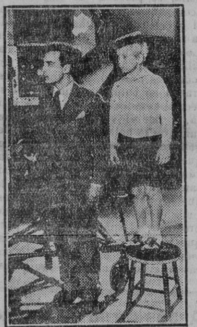
Buster Keaton acaba de descubrir a un temible rival

El conductor del vehículo, que está examinado para conducir, pero que carecía del oportuno carnet, fue detenido por la Guardia civil de aquel puesto, quedando a disposición de las diligencias practicadas se deduce que el camión marchaba a buena velocidad, sobre viniendo el accidente al llegar a una curva al referido kilómetro.