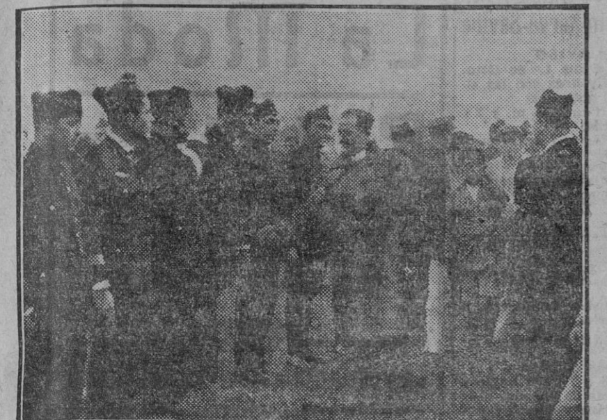
El glorioso piloto del «Plus Ultra», después de revisar las fuerzas de Aviación, estrecha la mano de un sargento, saludando a las clases

El jefe superior de Aeronáutica, comandante Franco, comenzó agradeciendo la actitud de consideración que hubo de guardarle siempre el Aero Club de Sevilla, y que dolorosamente ha tenido que contrastar con la del de Madrid.