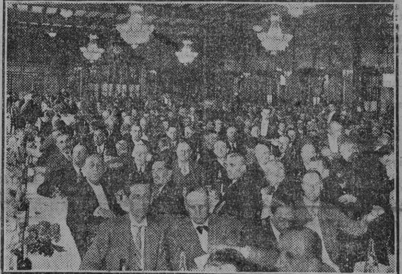
MADRID.—Aspecto del gran salón donde el jefe del partido reformista don Melquíades Álvarez, al pronunciar su discurso, se sintió repentinamente enfermo. (Foto. Agencia Gráfica.) (Fdo. Gori.)

Una sola opinión de una encuesta que no llegó a publicarse. En efecto, una sola opinión, doblemente magnífica, por breve de forma y aguda de fondo, obtuvo de cierta encuesta sobre Ateneos femeninos.