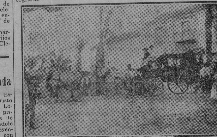
LA DILIGENCIA DE UTRERA