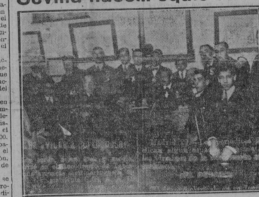
LCR REFORMISTAS De haber formado Gabinete don Melquiades esta fotografía hubiera tenido mucha más actualidad.