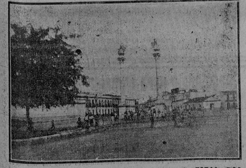
LOS PERROS, COMO EL PUB LICO LLAMA A ESTAS DOS COLUMNAS SITUADAS AL FINAL DE LA ALAMEDA GALERIN.

La segunda foto pertenece al final de la Alameda. En medio de los dos monolitos se ve la típica Pila del Pato, hoy colocada en el pasaje que existe a la entrada de la calle Calatrava. La parte de la derecha ha sufrido mucha variación. Esa casa de una sola planta ha sido sustituida por otra moderna. Esta segunda fotografía es, sin embargo, más moderna que la primera, pues en ella se ve el paredón de lo que fué cuartel de la Guardia civil, más tarde de Artillería y actualmente de las fuerzas de Seguridad. Ese paredón tendrá de treinta y cinco a cuarenta años. Antes tenía esa manzana de casas una puerta que miraba a la Alameda y era un colegio donde recibían instrucción los chiquillos que cogían los guardias vagando por las calles. Hace cuarenta años se preocupaban las autoridades por los chicos bastante más que ahora. Era una época en que por el Ayuntamiento se facilitaban a los chicos de los talleres unas chapas de metal para que pudieran circular por las calles libremente. Los aprendices que no fueran provistos de aquel requisito pasaban el día recluidos en aquel colegio, que tenía una población de escolares flotantes, pudiéramos decir. Estaba también en aquel edificio la Prevención municipal ó «casillas». ¿Quiénes serán y dónde estarán los pollos que toman el sol al pie de los leones?