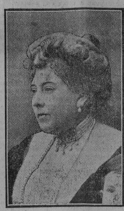
La princesa Beatriz, madre de la Reina Doña Victoria, que se halla gravemente enferma.