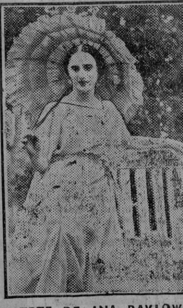
MUERTE DE ANA PAVLOVA.—Uno de los últimos retratos de la célebre danzarina rusa, fallecida en La Haya, víctima de una pleuresía.

Bombay 27.—La prisión de Gandhi, que acaba de ser puesta en libertad, databa del 5 de Mayo del año pasado.